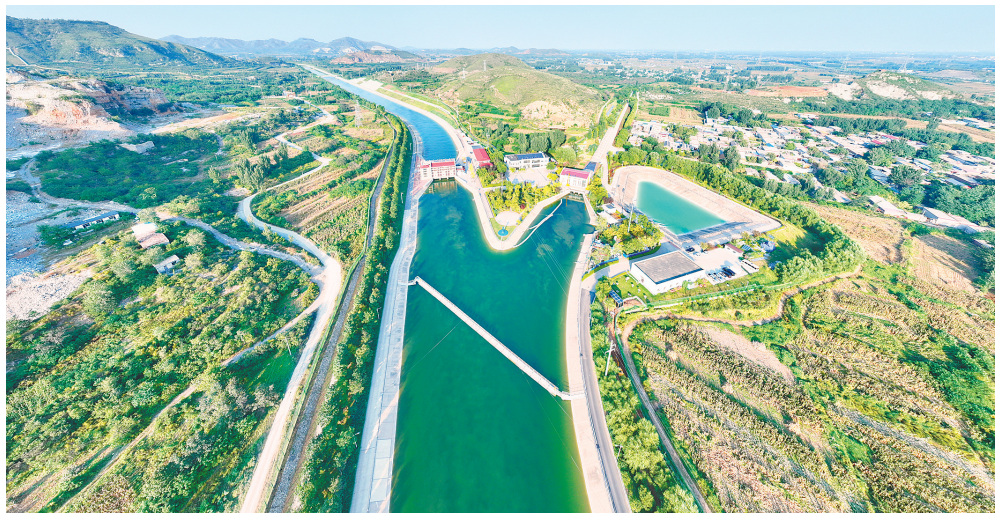
南水北调中线工程西黑山分水口。