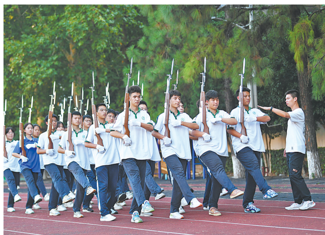
9月24日下午,护卫队在训练中。