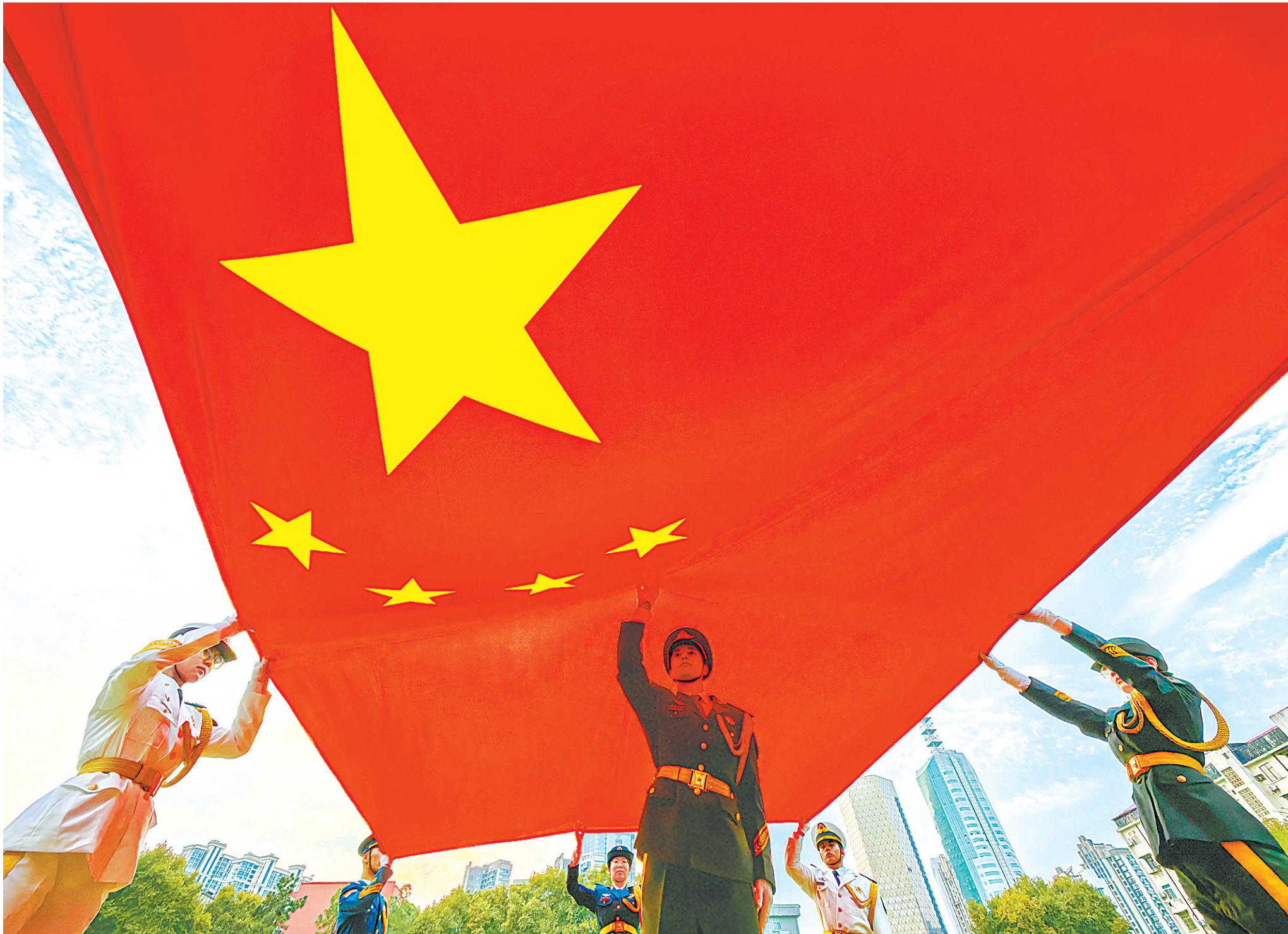
9月25日,护卫队员练习展旗、收旗等规范动作。