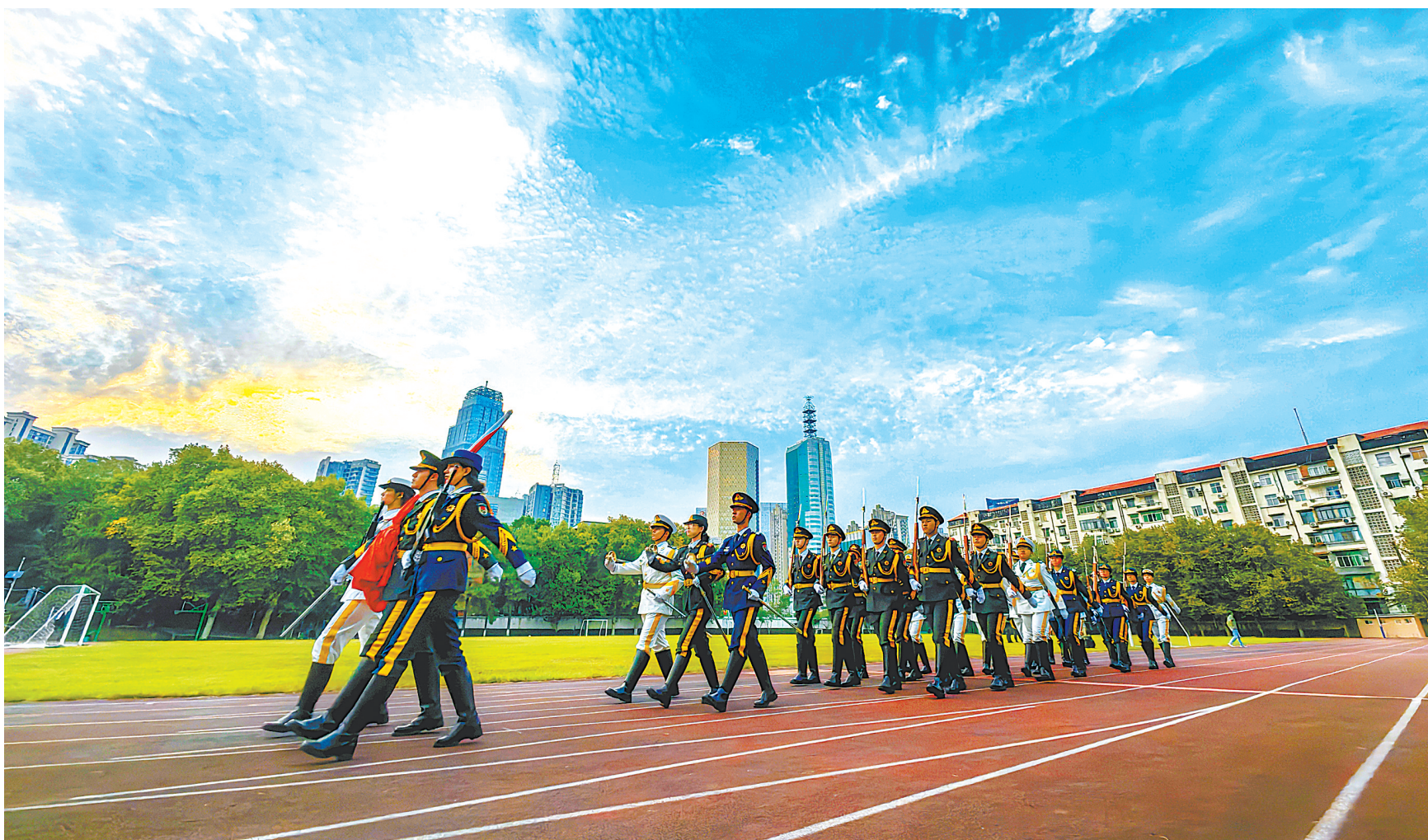
9月25日傍晚,彩霞满天,队员们训练后列队回营。