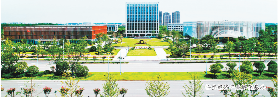
临空经济产业孵化基地。

随着花湖国际机场超级运力的释放,临空经济区和市相关部门、机场、顺丰等单位齐发力,从省内聚货源、从省外争货源。