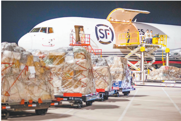
凌晨,鄂州花湖国际机场停机坪一片繁忙,工作人员有序装卸、转运货物。