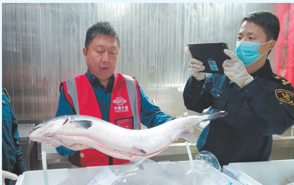
海关正在查验从南美运过来的三文鱼。