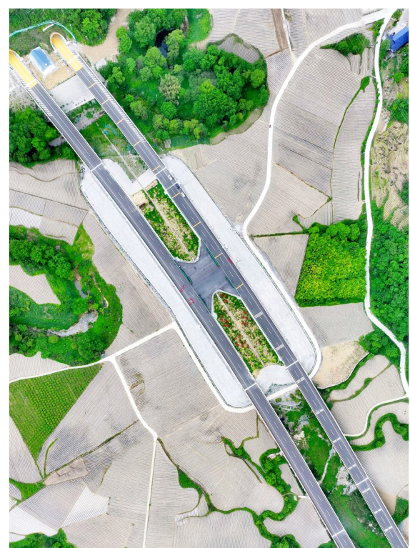
鹤峰东高速临时用地全面复耕复绿。田园如诗,美景如画。

鄂西建设公司坚持理念创新,坚持用统筹的观念谋划项目,用系统的思维推进工作,创新提出“方案管总、三同步、三同时”建设理念和40字管理方针。即:方案管总,技术领先;质安为本,品质为上;主附工程,同步推进;生态环保,坡绿水清;党建引领,创建文明。遵循标准化、信息化、智能化、人本化、精细化管理思路,将品质工程、平安工程、绿色示范工程、廉洁阳光工程建设贯穿施工管理全过程,为湖北山区高速公路建设探索管理经验。