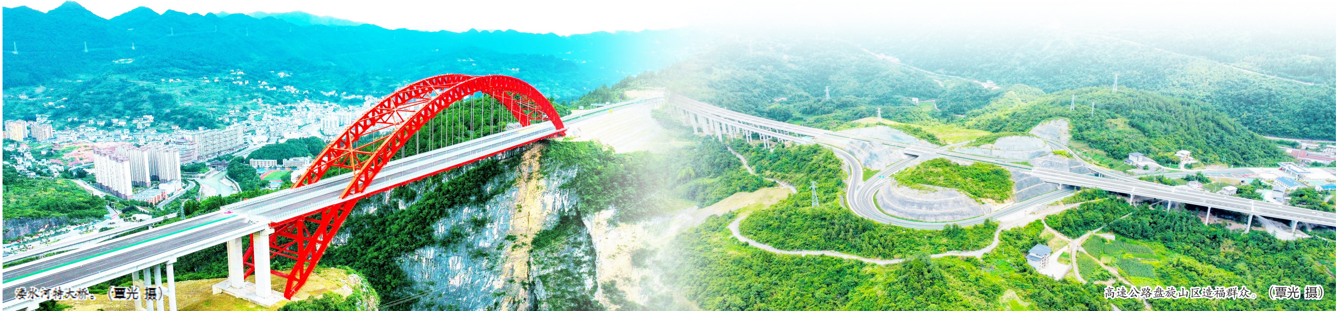
溇水河特大桥。