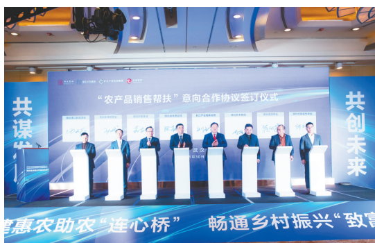
湖北省农业信贷融资担保应急转贷服务中心、湖北省农业信贷融资担保农产品销售帮扶中心正式揭牌。

目前,湖北农担公司正在蕲春、钟祥等地,探索推动地方政府以农担业务奖励资金或补贴担保费等形式,参与政银担合作,持续释放“1+1>2”创新效应。