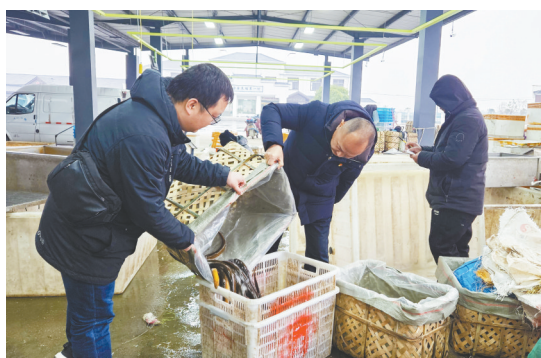
省农担公司仙桃办事处客户经理在张沟镇先锋村黄鳝交易大市场查看黄鳝交易情况。