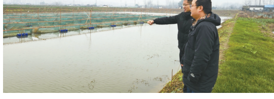
省农担公司仙桃办事处客户经理调研黄鳝养殖户。