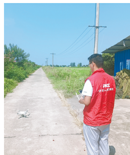
人保财险湖北省分公司农险工作人员正在操作无人机现场进行水稻验收工作。

推进乡村全面振兴是新时代新征程“三农”工作的总抓手,金融在其中发挥着重要作用。人保财险湖北省分公司将进一步担负起助力农业强省建设的政治责任,继续践行人民保险的政治性、人民性,围绕农业保险高质量发展,在产品研发、科技赋能、服务升级、保险普惠等层面精准发力,推动乡村全面振兴迈上新台阶。