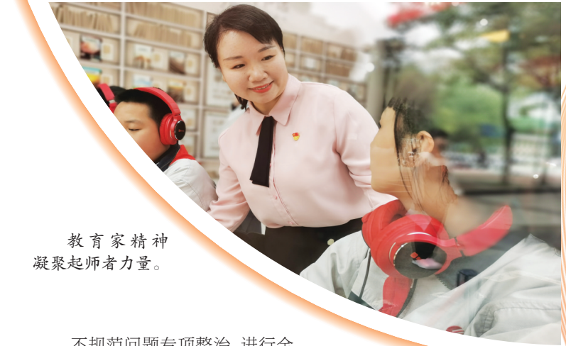
教育家精神凝聚起师者力量。