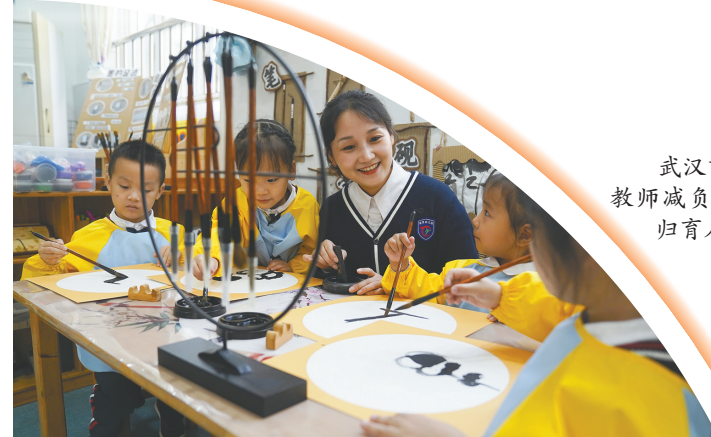
武汉市积极为教师减负,教师回归育人本位。