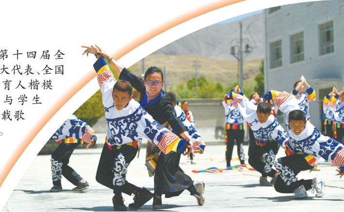
第十四届全国人大代表、全国教书育人楷模马丹与学生一起载歌载舞。

武汉市现有普通中小学校和幼儿园3069所,在校生161.92万人,教职工15.32万人,是我国当之无愧的教育重镇。党的十八大以来,武汉市委、市政府深入贯彻落实习近平总书记关于教育的重要论述和指示批示精神,把教师队伍建设作为教育事业改革发展最重要的基础工作来抓,着力打造一支师德高尚、业务精湛、结构合理、充满活力的高素质专业化教师队伍,坚定正确方向、服务国家需要,主动担当起高水平服务教育强国建设、支撑中国式现代化的历史使命。