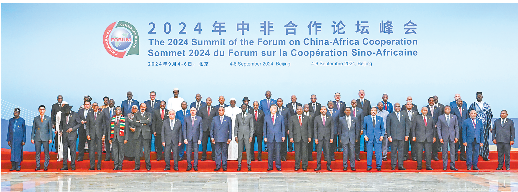
9月5日上午,国家主席习近平在北京人民大会堂出席中非合作论坛北京峰会开幕式并发表主旨讲话。这是开幕式前,习近平同出席峰会的外方领导人集体合影。

新华社北京9月5日电 9月5日上午,国家主席习近平在北京人民大会堂出席中非合作论坛北京峰会开幕式并发表主旨讲话。习近平宣布,中国同所有非洲建交国的双边关系提升到战略关系层面,中非关系整体定位提升至新时代全天候中非命运共同体,将实施中非携手推进现代化十大伙伴行动。中共中央政治局常委李强、赵乐际、王沪宁、蔡奇、丁薛祥、李希出席。初秋北京,高远澄明。天安门广场和长安街两侧,鲜艳的五星红旗同53个非洲国家和非洲联盟旗帜迎风飘扬。习近平同出席峰会的51位非洲国家元首、政府首脑以及2位总统代表,