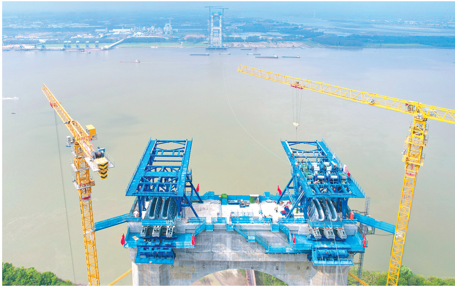
8月29日,燕矶长江大桥成功跨越1860米江面,完成先导索的架设,南北双塔顺利实现“牵手”。

湖北日报讯(记者戴辉、通讯员徐梦颖、陆落义)8月29日,世界最大跨径四主缆悬索桥——燕矶长江大桥完成先导索架设,南北双塔“牵手”成功,为大桥后续猫道、主缆及钢箱梁的架设等奠定基础。 上午9时许,站在长江鄂州段江边,可见燕矶长江大桥双塔矗立。在黄石海事局、武汉航道局黄冈海事处等部门配合下,江面已提前封航。随着三声汽笛声响起,拖轮牵引着先导索从鄂州侧的南塔向黄冈侧的北塔驶去。半小时后,先导索顺利到达北塔并完成连接。两岸塔顶卷扬机