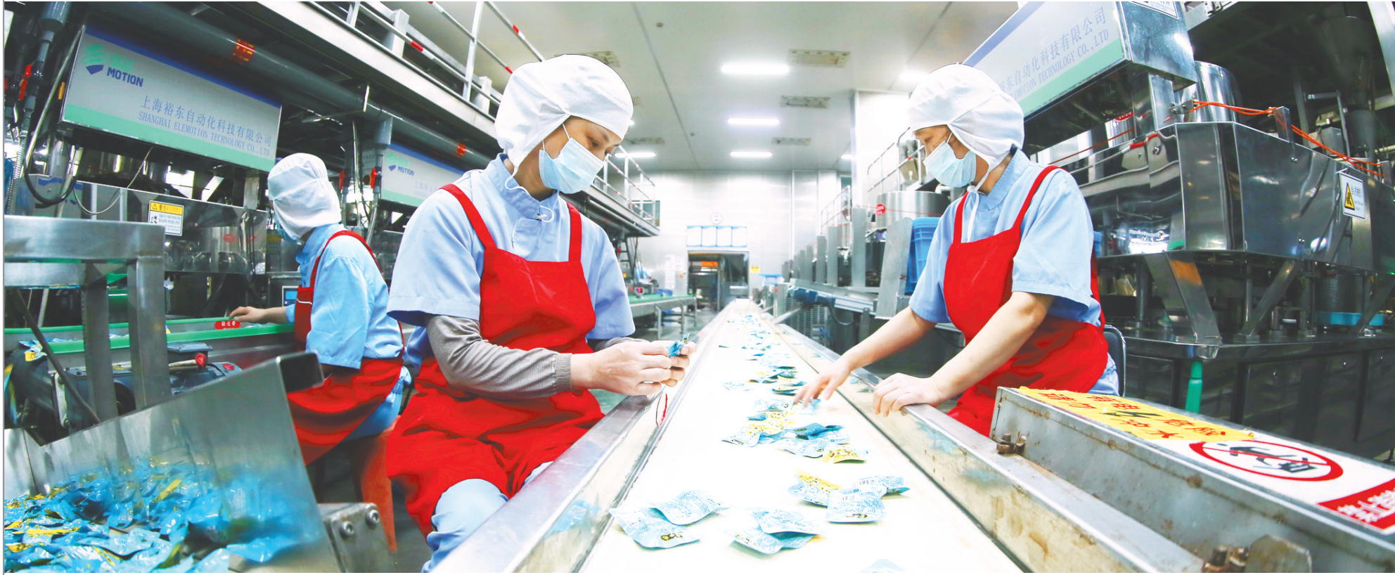
红日子公司机器臂自动装袋。

8月20日,湖北红日子农业科技有限公司装卸区,10多辆大货车排队等待装袋。每天,30多车酱菜从这里发往全国各地,出货量380余吨。