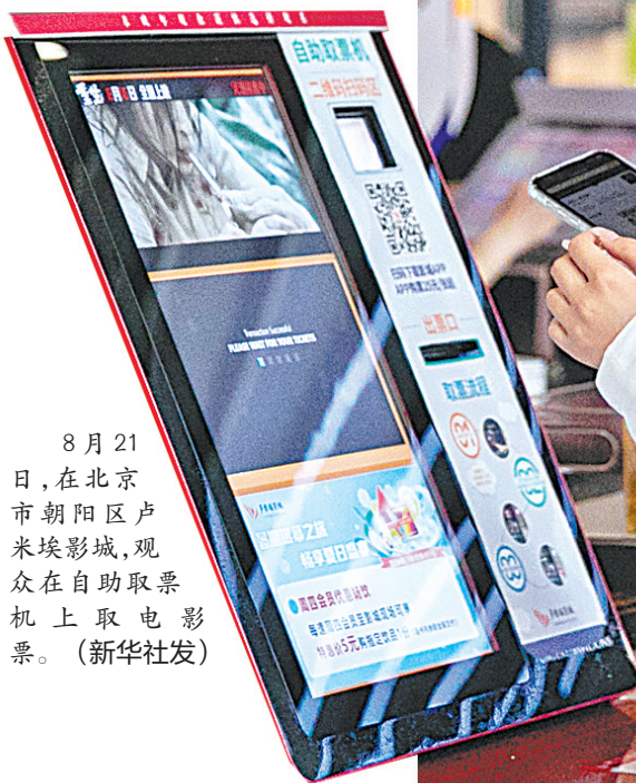
8月21日,在北京朝阳区卢米埃影城,观众在自助取票机上取电影票。

据网络平台实时数据,截至8月24日22时45分,2024年暑期档(6月—8月)档期总票房(含预售)突破