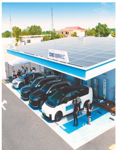
8月23日,位于福银高速孝感服务区内的超级充电站。

运营方西藏筒凡制氧科技有限公司负责人杨献忠介绍,进入“零海拔屋”休息按时收费,“最近云很重,很多游客来了以后不能马上看到珠峰。我们的两个舱正对山口,游客可以一边休息调整,一边等待观景。”杨献忠展示了一段游客自拍的短视频。一位中年女士在来到大本营的当晚失眠,凌晨4点才睡着,第二天全身乏力。“吸了氧,可没什么用。”她看到“零海拔屋”后进去试试,“待了半小时,马上神清气爽,脚上也有劲了。”此次在珠峰大本营投用的“零海拔屋”,创下了全球增压建筑投用地点的海拔新高。此前,“零海拔屋”系列产品已应用于南极科考站、拉萨酒店、高原铁路、川藏输电工程等。