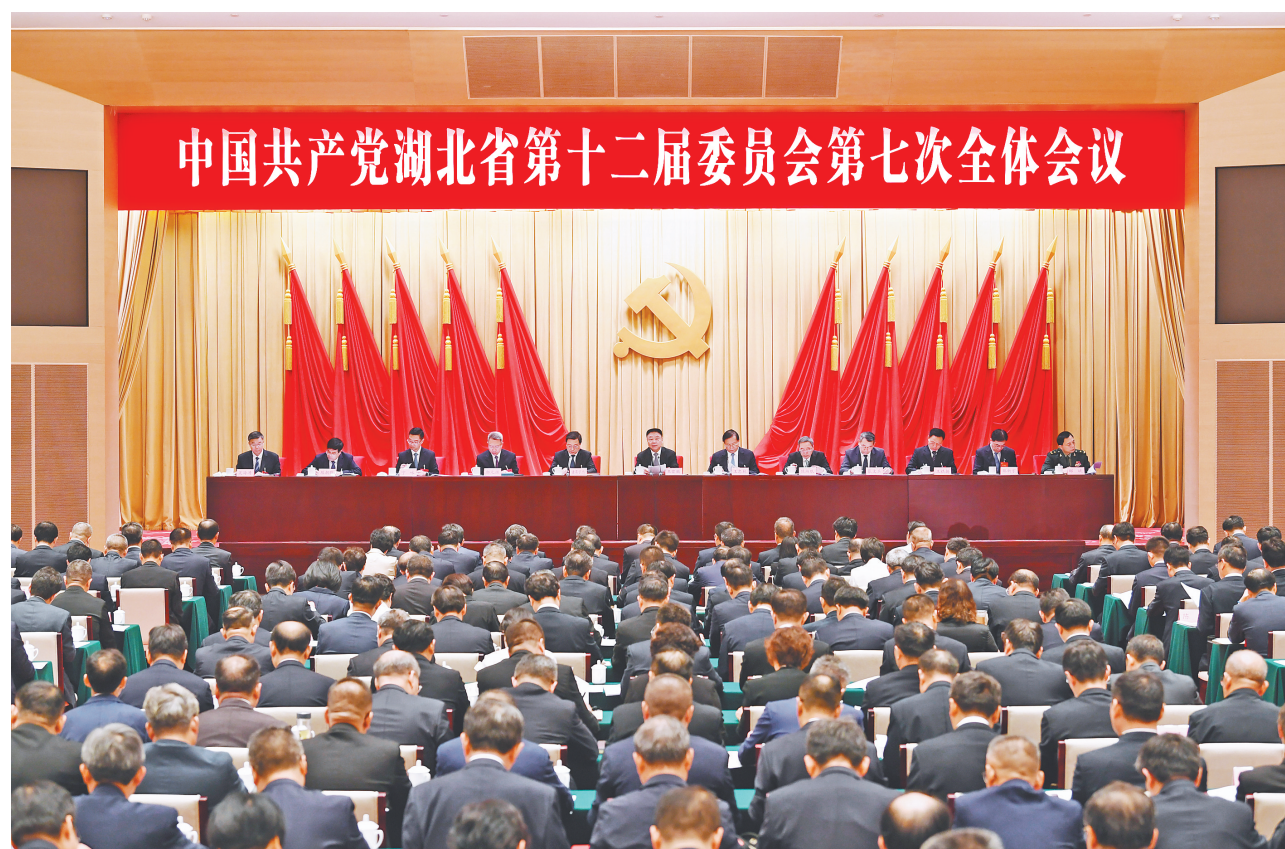
8月23日,中国共产党湖北省第十二届委员会第七次全体会议在武汉召开。

全会指出,近年来,湖北全面对标对表习近平总书记关于中国式现代化的重要论述和关于湖北工作的重要讲话、重要指示批示精神,将习近平总书记赋予湖北加快建成中部地区崛起重要战略支点的目标定位细化为“五个功能定位”,推动一系列打基础、利长远的体制机制改革创新,全面推进以流域综合治理为基础的“四化”同步发展,奋力推进中国式现代化湖北实践,探索形成了“五个以”的实践体系框架、“五个一”的省级发展调控机制,有力促进了经济社会平稳健康发展。站在新的历史起点上,以进一步全面深化改革推进中国式现代化湖北实践,必须全面贯彻习近平新时代中国特色社会主义思想,深入学习贯彻党的二十届三中全会精神和习近平总书记关于湖北工作的重要讲话、重要指示批示精神,紧扣推进中国式现代化这个主题,贯彻“六个坚持”的重大原则,以经济体制改革为牵引,以促进社会公平正义、增进人民福祉为出发点和落脚点,更加注重系统集成,更加注重突出重点,更加注重改革实效,持续完善实践体系框架,健全省级发展调控机制,为奋力推进中国式现代化湖北实践、加快建成中部地区崛起重要战略支点提供强大动力和体制机制保障。到二〇二九年,完成本决定提出的改革任务,推进中国式现代化湖北实践体系框架和省级发展调控机制不断丰富完善,中部地区崛起重要战略支点“五个功能定位”基本实