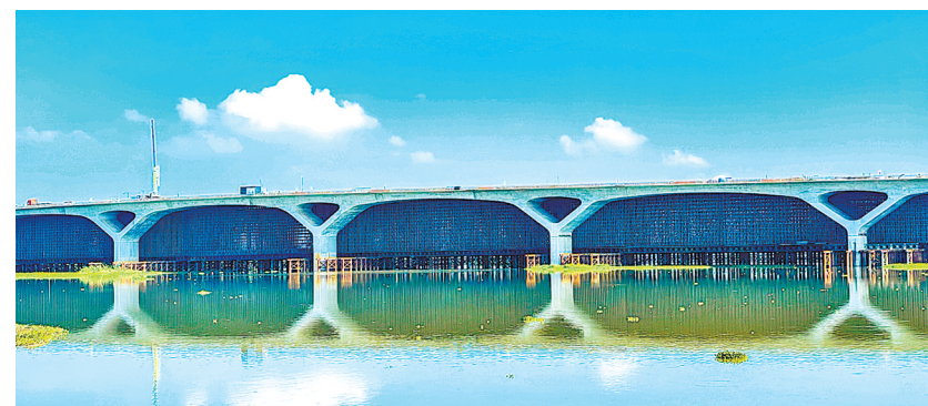
8月20日,鄂州吴楚大道花马湖大桥顺利合龙。

湖北日报讯(记者周鹏、通讯员刘春伟、王玉春)8月20日,随着第10联最后一个节点成功浇筑,由中铁十五局承建的花马湖大桥顺利合龙,全桥贯通,吴楚大道东延线全线通车在即。