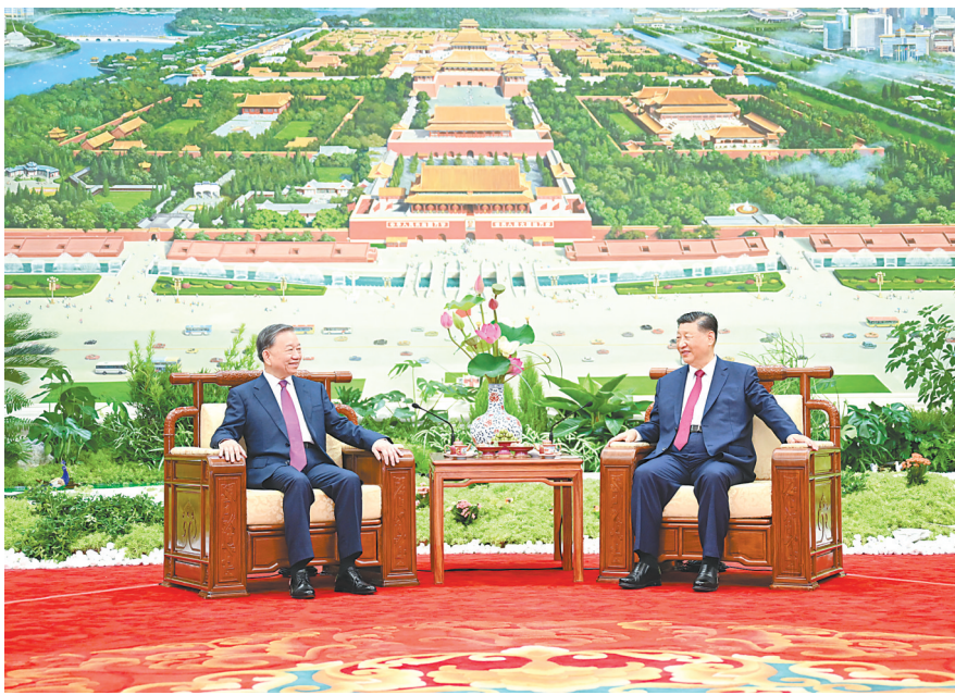
8月19日,中共中央总书记、国家主席习近平在北京人民大会堂同来华进行国事访问的越共中央总书记、国家主席苏林举行会谈。这是习近平同苏林进行小范围茶叙。

新华社北京8月19日电 8月19日,中共中央总书记、国家主席习近平在北京人民大会堂同来华进行国事访问的越共中央总书记、国家主席苏林举行会谈。