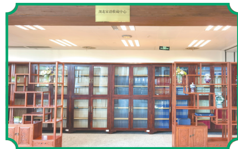
湖北家谱收藏中心。

国家图书馆常务副馆长、国家古籍保护中心副主任张志清曾这样评价湖北的家谱工作:“湖北省图书馆在家谱的采访、数字化目录出版等方面用力很多。创造性开展的晒谱活动已经成为全国晒书大会的明珠,有效激活了中华传统家风的现代生命力。”