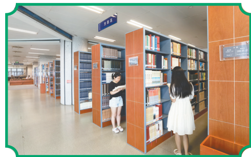
读者在湖北省图书馆阅读方志。