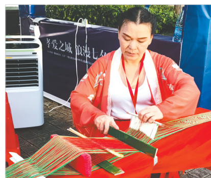
非遗市集上的大福织锦带技艺展示。