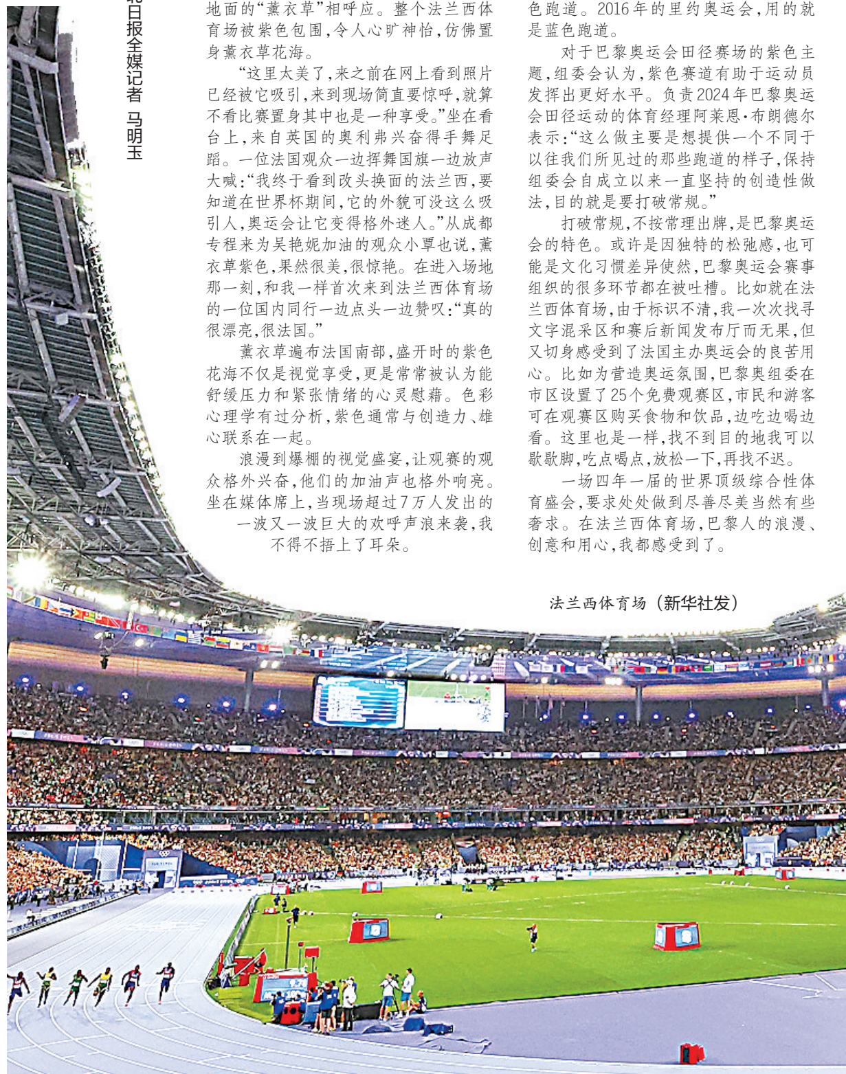
法兰西体育场

浪漫到爆棚的视觉盛宴，让观赛的观众格外兴奋，他们的加油声也格外响亮。坐在媒体席上，当现场超过7万人发出的一波又一波巨大的欢呼声浪袭来，我不得不捂上了耳朵。