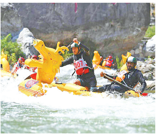
外国选手参加2023年中国宜昌朝天吼自然水域国际漂流大赛。

统龙舟赛和国际划联龙舟世界杯先后落地屈原故里;九畹溪漂流被国家体育总局水上运动管理中心确定为漂流训练基地;夷陵除各类山地、越野赛事外,新兴的溪降运动与三峡奇潭景区完美融合;南方罕见的高山天然滑雪场,在五峰、兴山和秭归拔地而起,去年12月的全国大众冰雪季,宜昌3个月接待游客53.55万人次,综合营收5237.86万元,同比分别增长234.91%和204.01%…… 如今,宜昌市的体育和旅游、赛区和景区早已亲密无间,难分彼此。 真心贴心 共创未来 共筑全民健身热潮,离不开更高水平、更接地气的公共服务体系。 宜昌出台的《全民健身赛事活动经费补贴办法》,鼓励体育社会组织和社会力量办赛,2023年为32项赛事拨付81万元奖金,如今市级赛事已超120项。《关于购买宜昌奥体中心公共体育服务的综合考评办法》2020年实施,累计筹措2500万元,免费或低收费向市民开放中心所属一场两馆一中心,市体育馆也连续三年位居全省公共体育场馆免收开放检查评比三甲。 为迎接全国大众冰雪季到来,宜昌发放冰雪温泉消费券1500万元,辐射、带动周边产业生活链;同时增加投入,在市中心完成50公里滨江公园休闲健身带建设,在公交站、口袋公园等边角配建健身设施,实现社区(村)健身设施全覆盖。 撒一批种子,拾一片金秋。据统计,2023年宜昌居民体育消费总规模101.65亿元,人均