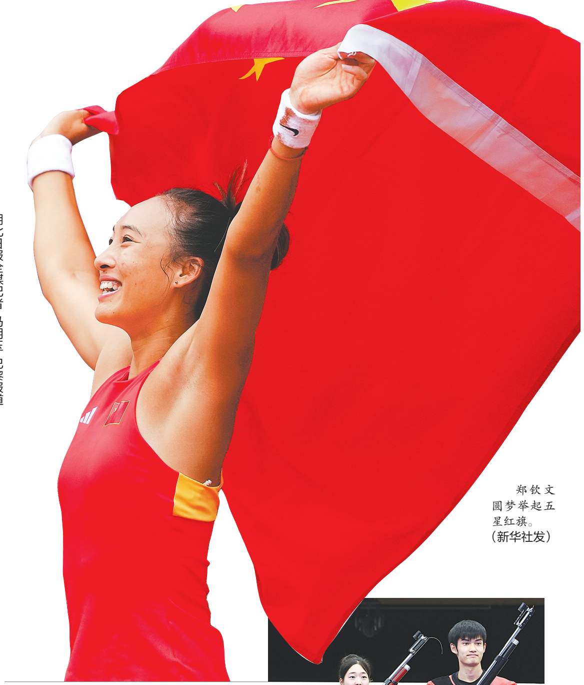
郑钦文圆梦举起五星红旗。

三年前的东京奥运会,中国队在乒乓球混双和跳水男双10米台意外丢金。征战巴黎,王楚钦/孙颖莎和吴/练俊杰把“重夺”刻进骨子里。两对组合接连在决赛中实现“东京丢的巴黎拿回来”。与之相应的是夺冠现场成了五星红旗的海洋。 随着潘展乐在男子100米自由泳这个中国人从未染指金牌的决赛赛场上狂飙突进,遭遇多重困难的中国泳军也迎来了历史性突破。决赛中,他以46秒40的优异成绩大幅度打破自己保持的世界纪录,并成为夺得该项目奥运金牌的第一位亚洲选手。赛后,他面对镜头的吐槽更是让人们看到他的率性和可爱,更被网友戏称“陆上博尔特,水中潘展乐”,此金一改游泳队沉闷局面,极大鼓舞了全队士气。后续比赛中,游