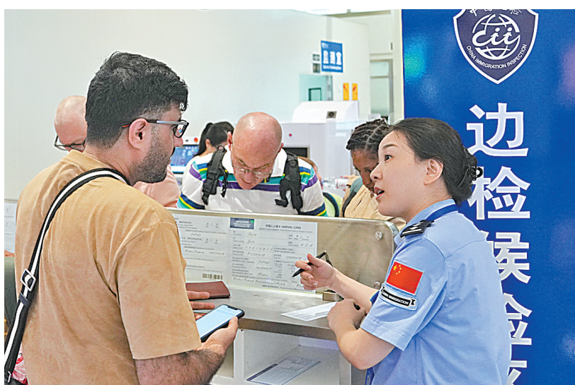
武汉出入境边防检查站民警在天河机场帮助过境免签旅客填写外国人临时入境卡片。

8月6日,湖北日报全媒体记者从湖北机场集团获悉,今年前7个月,全省8座机场共运输旅客2279.58万人次,比去年同期增长17.7%。其中武汉天河国际机场运输旅客1774.5万人次,比去年同期增长24.1%。