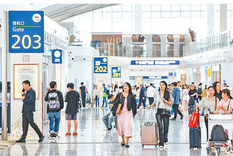
武汉天河机场航站楼内,旅客们已办好登机手续,准备出发。

截至目前,天河机场设有国际及地区航线16条。今年前7个月,天河机场吞吐国际及地区旅客66.9万