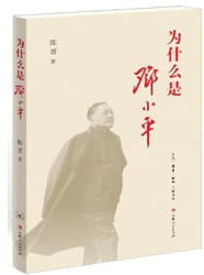
《为什么是邓小平》 陈晋 著 生活·读书·新知三联书店 吉林人民出版社

作者从唐代的政治、制度、文化等方面,剖析了杜甫的仕宦困境。其实盛唐人仕的途径非常多元,包括科举、门荫、军功、举荐、人幕等,其中最主流的两个途径是科举和门荫。对于少年杜甫来说,祖辈父辈无法给他以门荫,“快意八九年”之后,杜甫虽有门荫资格,但他依旧坚持走科举入仕。作者分析,一是心气理想上,门荫入仕“不如科举及第来得光彩”;二是现实难度上,这类入仕途径“备受宦官子弟追捧,并非唾手可得”。只是心气高傲、才华横溢的杜甫不知道,未来的几十年,他会在仕宦理想与现实困境中不断挣扎,人生屡屡受挫。