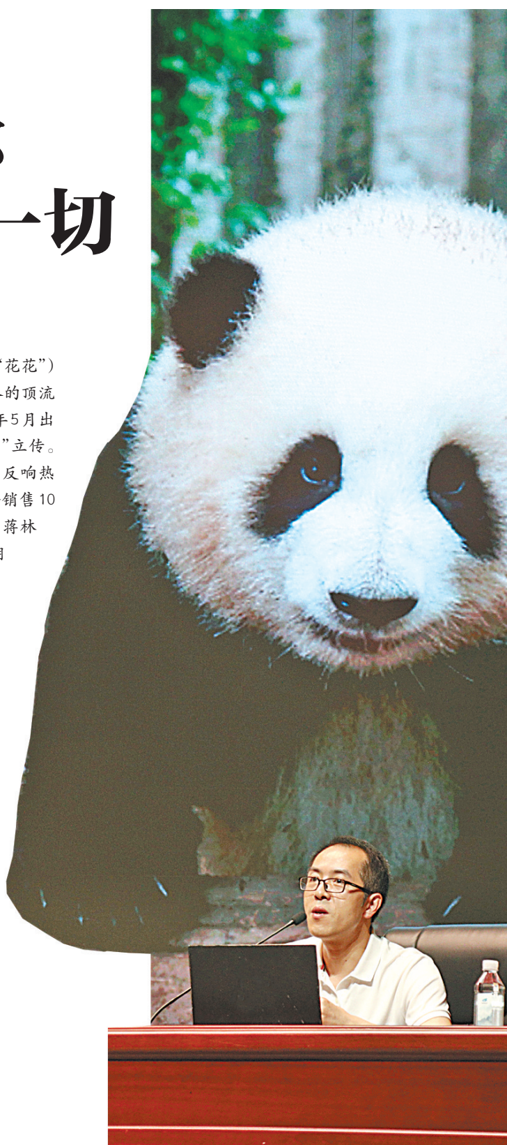
蒋林在讲座中。

缓慢,是花花的生命特征。吃饭慢,走路慢,爬树慢,长得慢。就连地震来袭,它的反应都比其他熊貓慢半拍。蒋林说,慢,看似花花的软肋和缺点,反而成了它俘获人心和引发共情的密码。因为,我们身处一个快到让人身心疲惫的时代。在一个看电视剧和综艺节目都要用倍速的时代,花花的“慢镜头”生活,让我们深思和向往。我们为什么那么着急?我们为什么那么匆忙?我们为什么就不能慢下来,让身体和灵魂好好休息?