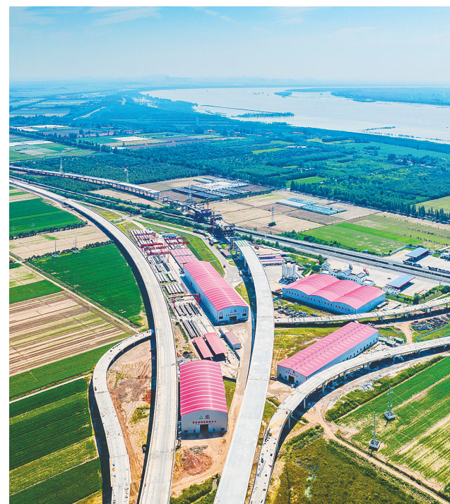
正在加紧建设中的武松高速公路武汉段。武松高速项目由武汉段、仙桃至洪湖段、万全至监利段、监利至江陵段、江陵至松滋段(含观音寺长江大桥)等5段高速组成,线路总长约222公里。