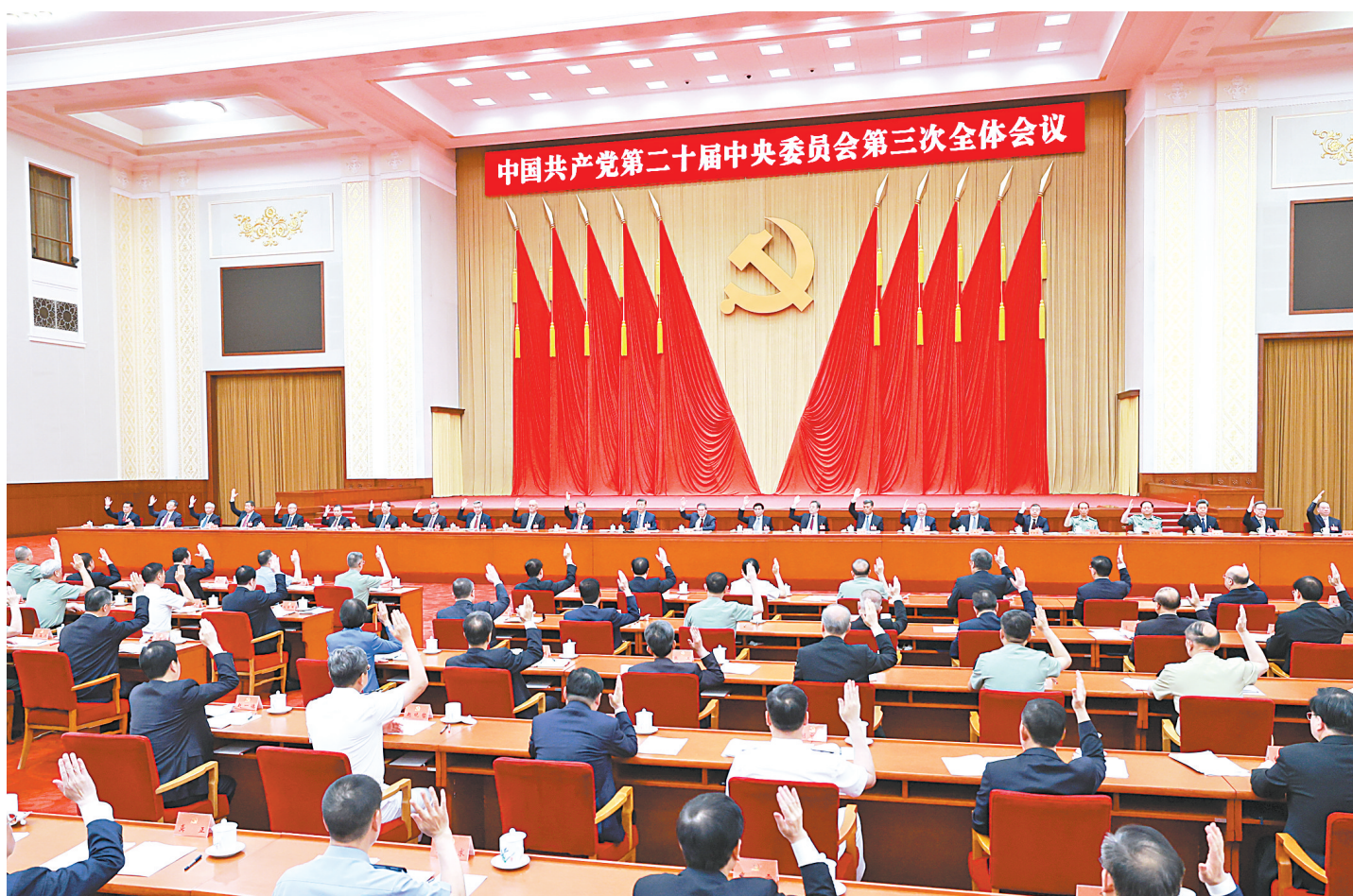
中国共产党第二十届中央委员会第三次全体会议,于2024年7月15日至18日在北京举行。中央政治局主持会议。(新华社发)

新华社北京7月18日电 中国共产党第二十届中央委员会第三次全体会议公报(2024年7月18日中国共产党第二十届中央委员会第三次全体会议通过)