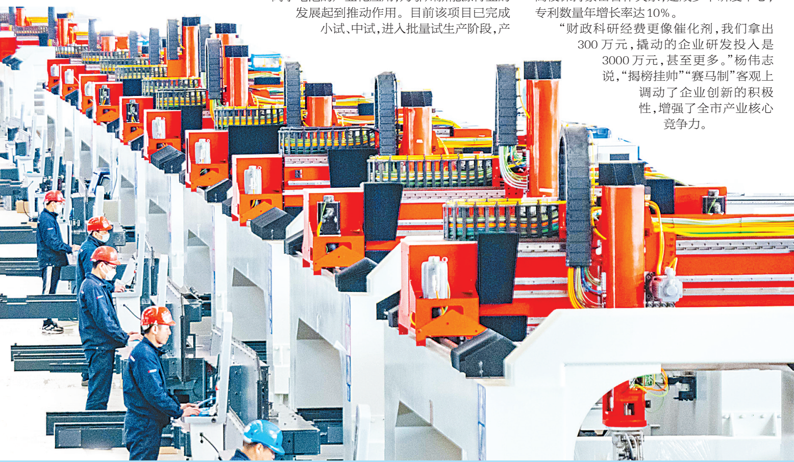
华工法利莱公司员工调试激光设备。

6月28日,鄂州市科技局发布2024年“赛马制”重点科技项目申报指南,鼓励企业同台竞技,攻克关键技术。这是该市第二次在科技项目中启用“赛马制”,首批立项的4个“赛马制”科技项目已实施一年。 2021年,鄂州面向全国发布6个科技项目“揭榜挂帅”榜单,首次探索重点技术攻关“揭榜挂帅”制。几年来,全市已连续4次发布“揭榜挂帅”榜单,推动一批科研成果在生产一线落地转化。 “无论‘揭榜挂帅’,还是‘赛马制’,都是利用市场竞争来激发创新活力,聚集更广泛的创新资源,形成科研攻关能者上的创新生态。”鄂州市科技局局长杨伟志说。