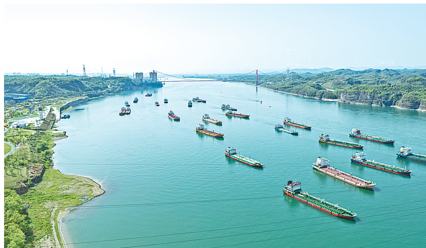
雨后的长江宜昌段山清水秀,清澈的江面上千帆竞发。

万古奔腾的长江,纳百川千湖,滋养锦绣壮美的华夏大地。 党的十八大以来,习近平总书记的足迹遍及大江上下,一次次深情眺望,一句句殷切叮嘱,一项项深谋远虑,情牵母亲河保护,指引高质量发展。 今日长江,在保护与发展中,浩荡前行。 当花湖国际机场一架架航班飞越洲际,空中丝路畅通全球时,湖北天鹅洲长江故道内长大的江豚放牧和围网已成功回到母亲河怀抱; 当万吨级江海直达货轮首次通过三峡大坝时,石首奔豚的麋鹿族群已开始孕育新的生命,曾经消失的物种失而复得…… 一幅幅充满生机、绿意盎然的生态画卷,在荆楚大地徐徐展开,见证一江碧水展新颜。 湖北牢记嘱托、勇毅探索,以流域综合治理为纲,统筹保护与发展,长江湖北段连续5年全线水质达到Ⅱ类。 “立规之地”弹出“绿色音符” 长江干流岸线最长省份扛牢责任担当 1061公里,是长江干流在湖北境内留下的“足迹”。湖北,长江干流岸线最长省份。 (下转第3版)