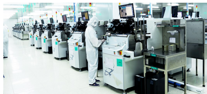
长江产业集团旗下子公司万润科技的LED无尘生产车间。

未来，光电子供应链公司将重点聚焦光电子龙头企业，对接上下游关键客户，依托“芯光链”线上交易平台，打造光电子信息领域的科创供应链“天网”，积极推动成熟工艺芯片出海，并与湖北长江光电子产业投资公司开展“投前、投中、投后”的战略协同。