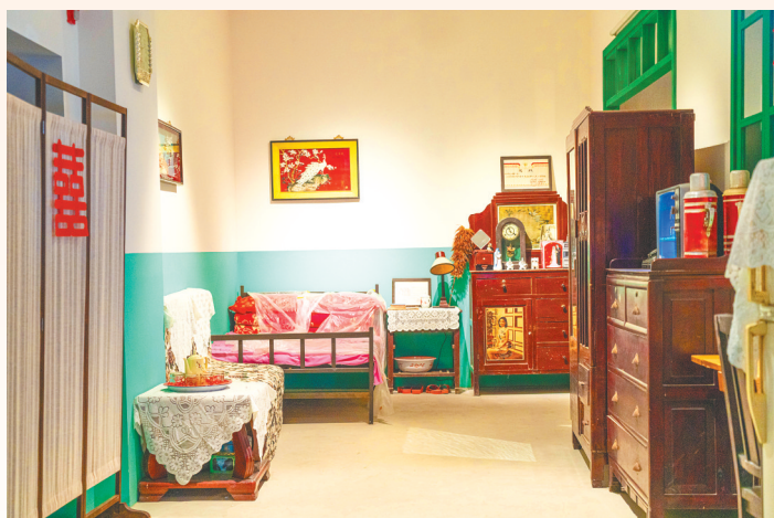
展厅还原了上世纪80年代“三转一响”配置齐全的婚房。