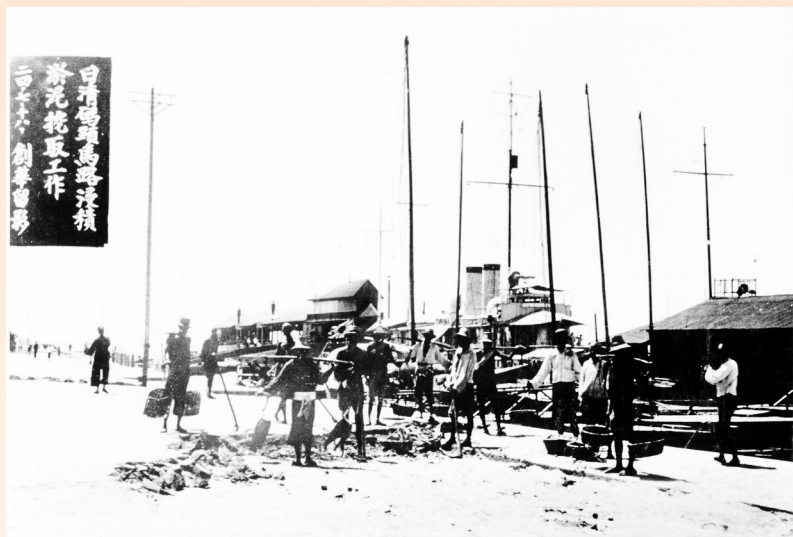
开埠后，沙市日清码头桅杆林立，一片繁忙。