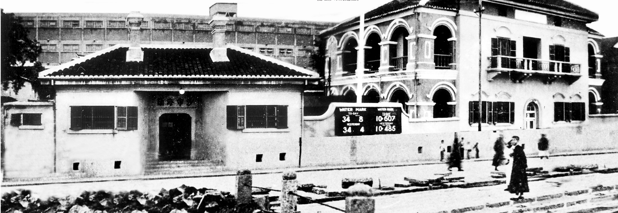
百年前，沙市海关大楼(左)和税务司楼(右)分别为中式和西式风格。

手可及，令前来游览、怀旧的游客感慨万千。本报记者探访这两处展馆，虽然历经岁月变迁，这些珍贵的老照片和历史遗存让沙市洋码头这片土地的发展历程触目惊心。1949年，文化展示馆和沙市工业成就展分别设立在改造后的沙市打包厂和“活力28”老厂房中。近日，湖北日报全媒记者田佩雯在荆州沙市洋码头文创园沙市记忆(1876-1949)文化展示馆和沙市工业成就展分别设立在改造后的沙市打包厂和“活力28”老厂房中。近日，湖北日报全