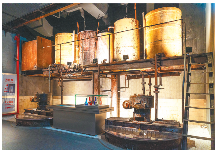
江汉明珠工业成就展示馆保留了当年“活力28”洗衣粉的生产设备。