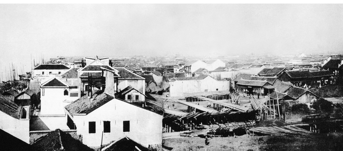
百年前，沙市江边的民居。