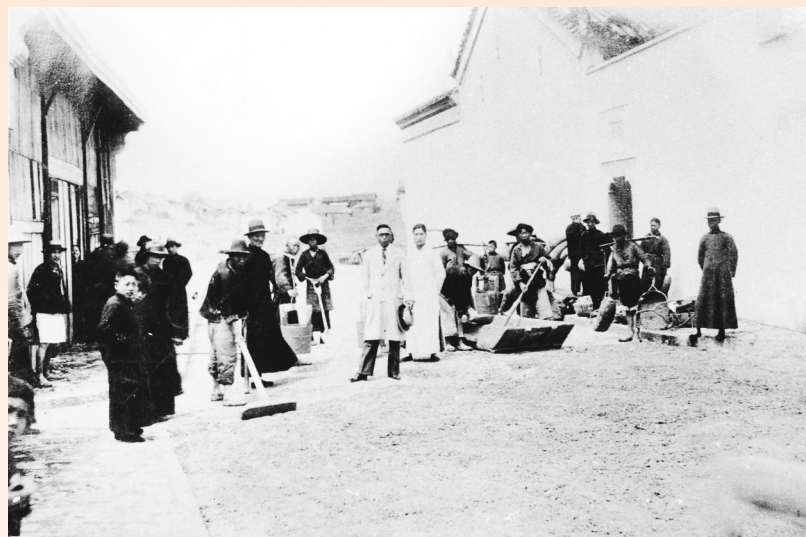
民国时期，修建洋码头交通右路。