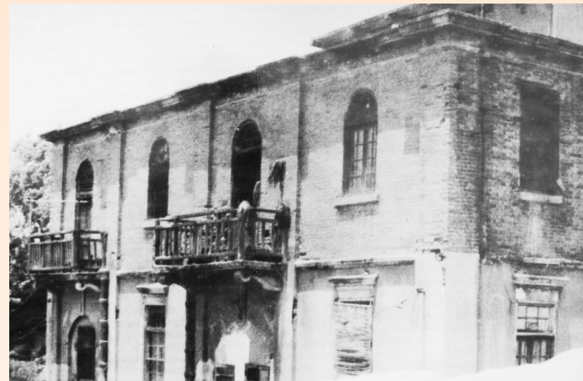
民国时期，民生公司办公楼。