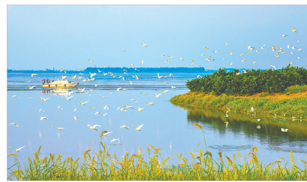
枝江金湖成为鸟类天堂。

用法治的力量守护河湖安澜。宜昌编制《水行政执法服务指引》,制定河湖库“四乱”问题发现、处理、整改销号工作流程,强化问题整改和执法监管。推进河湖“清四乱”常态化规范化,深入开展河湖安全保护执法专项行动,整治河湖“四乱”问题800多处,整改涉水岸线利用项目194个。整合水文、生态环境、渔政等数据资源,搭建江河湖库智慧监管一个平台,实现重点河湖重点区域“四乱”问题可视、可知、可控。持续深化“河湖长+检察长”“河湖长+警长”,建立“长江三峡生态检察官”制度,办理涉流域公益诉讼案件267件。建立河湖管护社会监督员制度,出台河湖问题举报奖励制度,上线“河湖问题随手拍”小程序,打通基层管护神经末梢。成立长江大保护志愿服务联盟,吸纳品牌志愿服务队139支,推动全流域一体化行动、区域间联动。