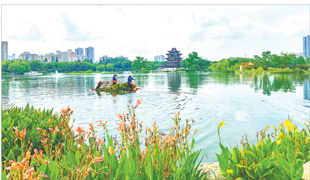
武汉市紫阳湖水清岸美。