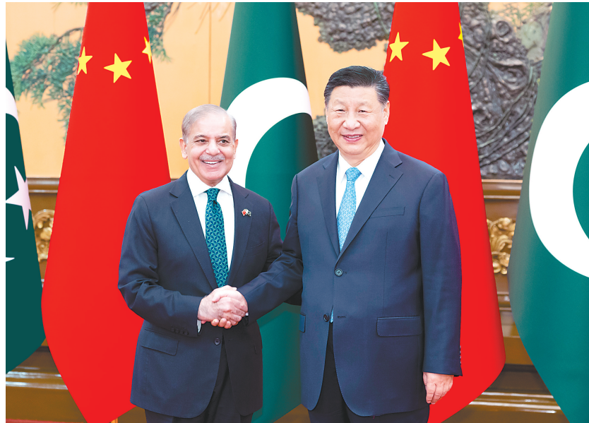
6月7日下午,国家主席习近平在北京人民大会堂会见来华正式访问的巴基斯坦总理夏巴兹。(新华社发)

习近平强调,中巴铁杆友谊历久弥坚,关键在于双方始终相互理解、高度信任、坚定支持。感谢巴方在涉及中国核心利益和重大关切问题上长期坚定支持中国。中方也将一如既往地坚定支持巴方捍卫国家主权和领土完整,支持巴方走符合本国国情的发展道路,支持巴方坚定打击恐怖主义。中方愿推动高质量共建“一带一路”同巴方发展规划对接,因地制宜开展农业、矿业、社会民生等领域合作,以打造中巴经济走廊“升级版”为中心,共建增长、民生、创新、绿色、开放“五大走廊”,推动高质量共建中巴经济走廊走深走实,助力巴基斯坦经济社会发展。希望巴方持续创造安全、稳定、可预期的营商环境,切实保障在巴中方人员、项目、机构安全。中方愿同巴方加强在联合国、上海合作组织等多边机制内的协调配合,共同推动平等有序的世界多极化和普惠包容的全球化,聚焦发展议程,应对安全挑战,完善全球治理,维护发展中国家共同利益和国际公平正义。