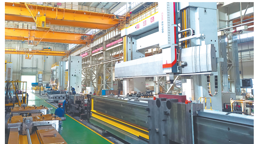
武重最新高端重型机床产品在用户现场。

巨大的轰鸣声响彻天际，赤橘色烈焰瞬间迸出，火箭呼啸着破云直上。5月21日，“湖北造”快舟十一号固体运载火箭顺利将“楚天”星座001星、“武汉一号”等4颗卫星送入预定轨道。这意味着，“湖北箭”快速“湖北星”已达9次20颗。 作为全球唯一一款运载能力达到1吨级的车载发射的固体运载火箭，