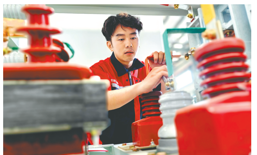
5月16日,襄阳双龙威机电科技有限公司员工在生产出口的高压软启动柜。该公司生产的10兆瓦及以上高端高压固态软启动柜装置产品,远销欧洲、非洲等地区,其以零下30摄氏度极端严寒天气下免维护等优质特色,实现在国际赛道上大步跨越,发展新质生产力注入新动能。

有了固定的收费标准和班次时间,运营两个月以来,乘客日渐增多。工作日,每天船票收入稳定在约1000元,节假日可超过4000元。 村民李庆会说:“现在开船时间贴在候船室墙上,准时出发、准时回来,方便得很。” “五一”假期,每天要往返20多个来回,运送车辆400余台次、人员近2000人次。”长寿岛村党支部书记李景辉说。 长寿岛,同时也是国家湿地公园,拥有河流、滩涂、岛屿等多种湿地生境,栖息着白鹭鹭、小天鹅、鸳鸯等数十种国家二级保护鸟类。 近期,越来越多的游客选择先在牛首渡口打卡,再乘船与汉江亲密接触,最后登岛感受鸟语花香……长寿岛休闲庄园老板海波介绍,“五一”假期,中餐和晚餐爆满,5天的营业额超过2万元。 目前,长寿岛已建成自行车道、儿童游乐场、长寿桥、观景台等游览娱乐设施,新开8家星级农家乐,正在规划建设民宿区、露营地、烧烤区、垂钓区、水上活动区等。