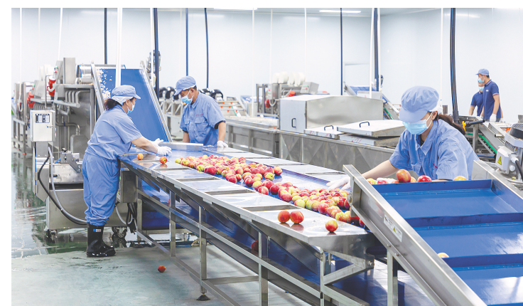
硒菜福公司生产线。

5月15日,仙桃市郑场镇工业园区,湖北硒菜福食品股份有限公司(以下简称“硒菜福公司”)固体饮料车间里机器运转,工人忙碌有序,一只只固体饮料包“走”下生产线。“这批产品将出口蒙古国,客户要得急,我们正加班加点赶订单。”公司董事长袁友元说。一个月前,该公司签下这笔价值2.4亿元的国际订单。成立11年来,硒菜福公司深耕当地农产品精深加工领域,不断扩大朋友圈,从江汉平原小镇走向国际市场大舞台。