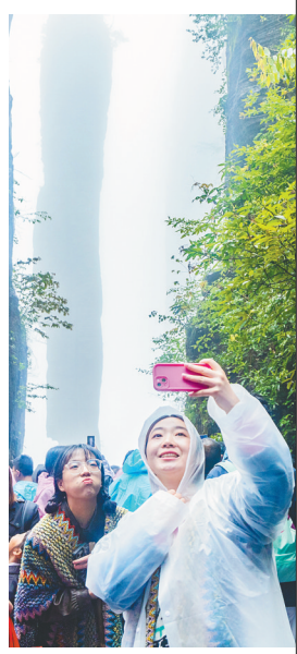
“五一”假期,游客在恩施大峡谷景区游玩。