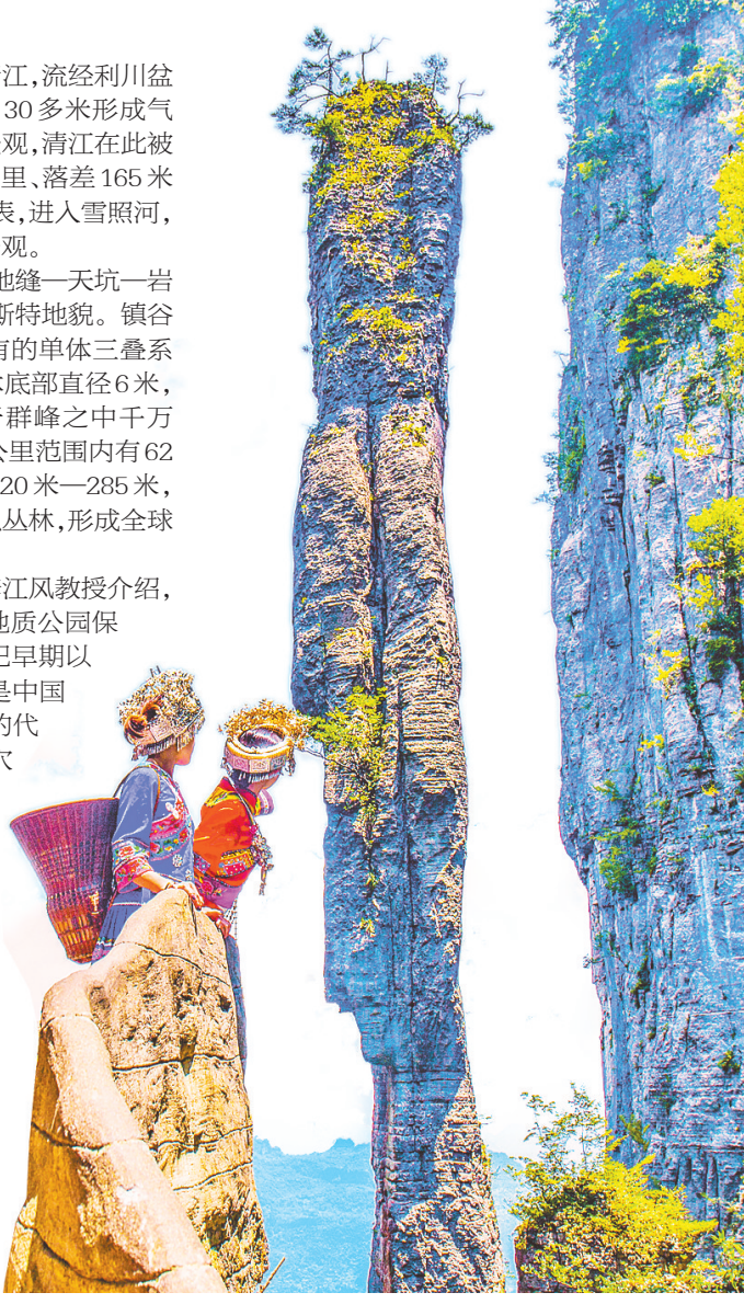
恩施大峡谷“一炷香”。

中国地质大学(武汉)李江风教授介绍,恩施大峡谷—腾龙洞世界地质公园保留了距今5.39亿年的寒武纪早期以来的海、陆完整沉积记录,是中国南方亚热带岩溶地貌类型的代表地区之一。以腾龙洞洞穴系统、清江伏流、大峡谷“一炷香”为代表的石柱式峰林等地质“留痕”,生动记录了自青藏高原隆升以来鄂西山地喀斯特地质地貌和水文地质多期次演化的完整序列,具有极高的国际地学价值和全球对比意义。