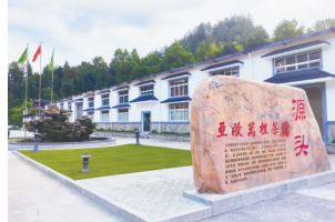
亚欧万里茶道源头。

襄阳茶区地处北纬32度左右的国内名优绿茶生产的黄金纬度线,独特的自然生态,有利于高香绿茶的生产。襄阳高香茶外形纤秀,色泽翠绿,香气清高持久,汤色嫩绿明亮,滋味鲜醇爽口,叶底肥嫩,耐冲泡。