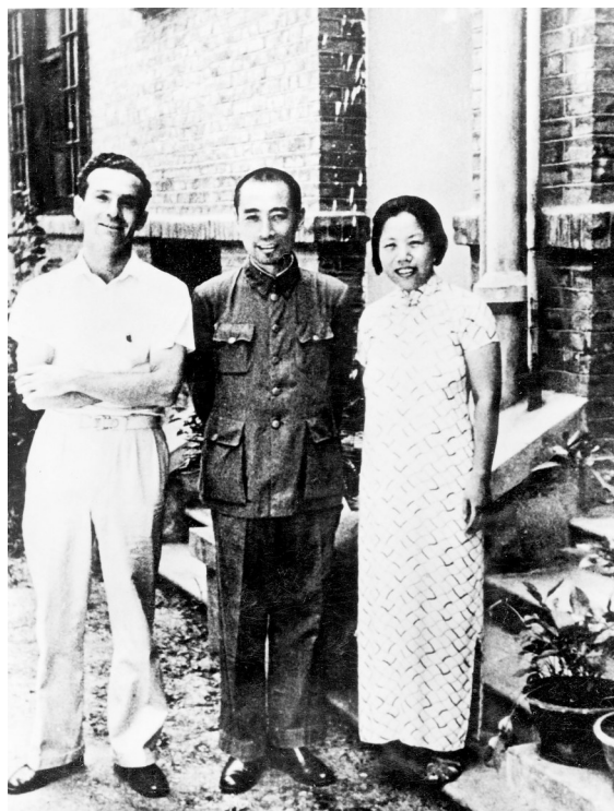
周恩来邓颖超与斯诺(左一)在武昌珞珈山合影。

展览用近两百张珍贵历史照片及视频资料、40余件实物展品，在复古播放机、怀旧听筒、空战投影等现代化多媒体设备加持下，营造出沉浸式观展氛围。配合讲解员的生动讲述，一个个有血有肉的英雄形象、感人至深的正义之举跃然而出。