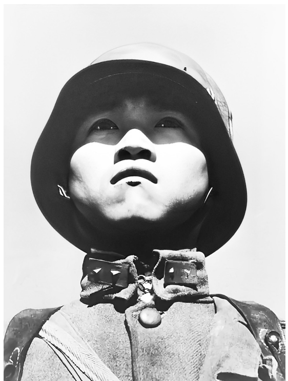
1938年，汉口，十几岁的中国士兵，《生活》杂志封面。