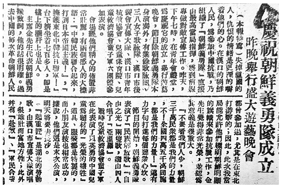
1938年10月14日的《新华日报》刊载的朝鲜义勇队成立的新闻。

斯诺还与妻子海伦·斯诺和路易·艾黎等人发起成立中国工业合作协会。1938年，中国工业合作协会在汉口的横滨正金银行正式成立，斯诺也成为“工合”的宣传者和争取外国支持的发言人。抗战时期，中国工业合作协会快速发展，对于当时工业建设起到了较大作用。