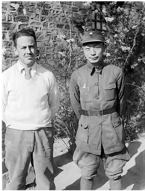
1939年5月，聂荣臻与乔治·何克(左)。

展览从武汉抗战中的国际友人的角度切入，将文物和史料紧密结合，使得国际友人们的英勇事迹得以跨越80多年的历史烟尘，栩栩如生地展现于观众眼前。