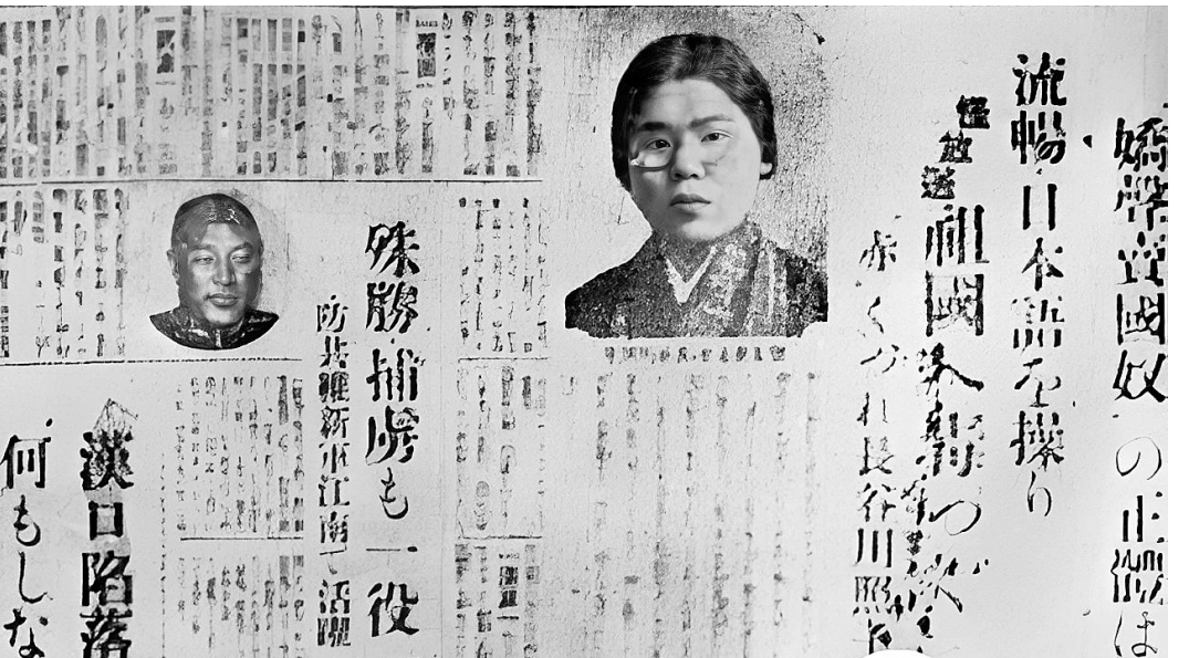
绿川英子被日本军国主义批判为“娇声卖国贼”。