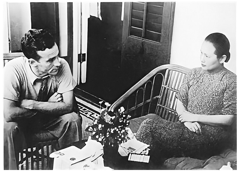
斯诺向宋庆龄介绍工会发展情况。