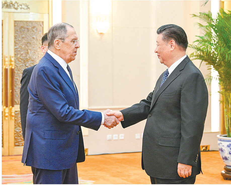
4月9日下午,国家主席习近平在北京人民大会堂会见俄罗斯外长拉夫罗夫。

终顺利稳定向前发展。双方要以庆祝建交75周年和举办中俄文化年为契机,全面落实我和普京总统达成的一系列重要共识。