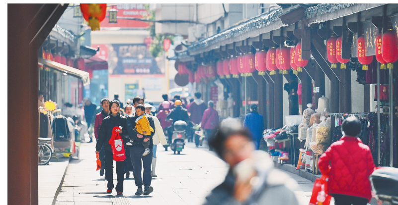
3月19日,市民在古色古香的当阳南子巷商业街逛街购物。(湖北日报全媒体记者 刘曙松 通讯员 陈昕 摄)

田间地头架起手机直播销售农产品,当天就能发货;以往只能到乡镇一级的快递直接送到村民手中;乡镇商贸中心内,超市、儿童乐园、餐厅、修鞋铺一应俱全……随着县域商业体系日益完善,小县城和镇、村正悄然改变模样。 近年来,我省以县域商业体系建设为切口,加快补齐城乡商贸流通各