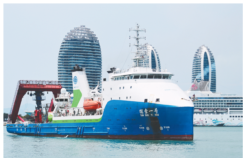
3月28日，“探索一号”科考船缓缓驶入三亚港。

新华社三亚3月28日电 记者从中国科学院深海科学与工程研究所获悉，3月28日，“探索一号”科考船搭载“奋斗者”号全海深载人潜水器返回海南三亚。此次科考历时50天，顺利完成中国—印度尼西亚爪哇海沟联合深潜任务。