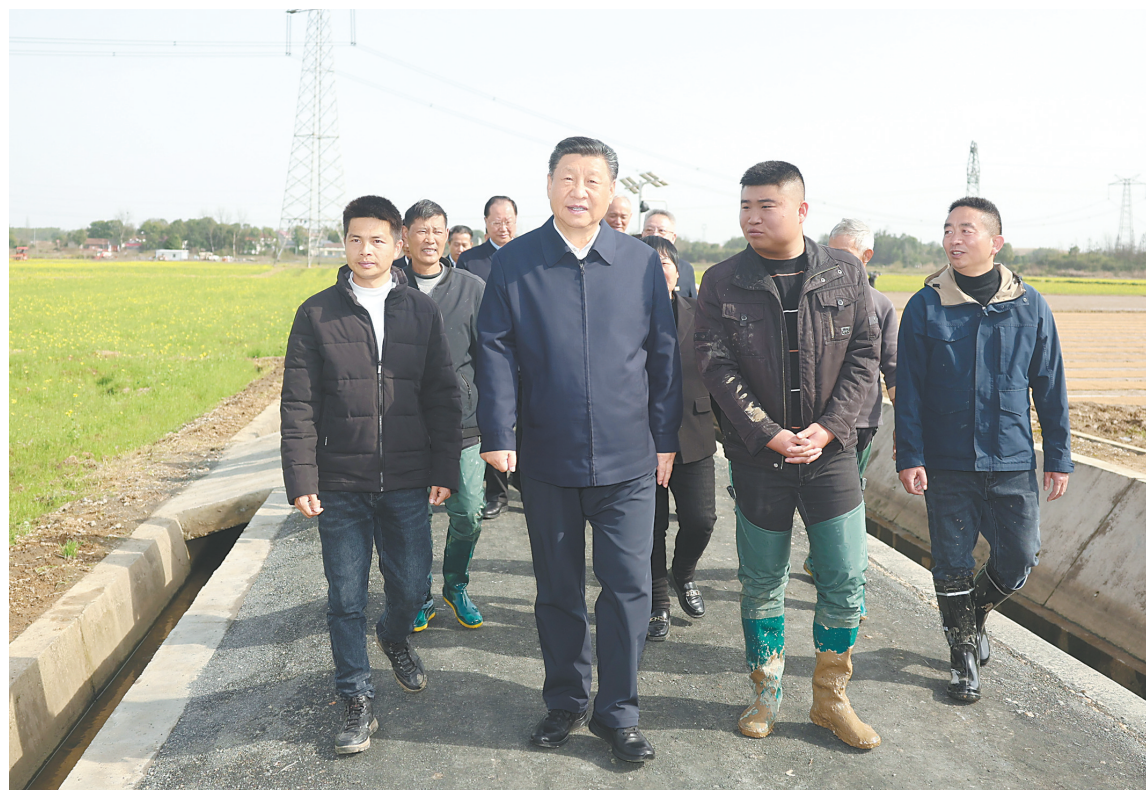
三月十八日至二十一日,中共中央总书记、国家主席、中央军委主席习近平在湖南考察。这是十九日下午,习近平在常德市鼎城区谢家铺镇中坪村,同种粮大户、农技人员、基层干部亲切交流。

随后,习近平来到巴斯夫杉杉电池材料有限公司考察。这是一家主营锂离子电池正极材料研发、生产和销售的中德合资企业。习近平听取当地加快发展新质生产力、扩大高水平对外开放等情况介绍,察看企业产品展示,了解材料性能测试情况和电池生产流程。他强调,科技创新、高质量发展是企业不断成长壮大、立于不败之地的关键所在,民营企业、