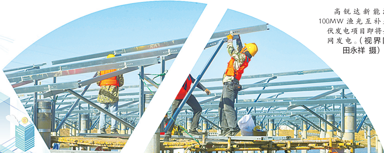
高锐达新能源100MW渔光互补光伏发电项目即将并网发电。

去年,长江(潜江)基金管理人又瞄准桐力光电项目。桐力光电是一家苏州企业,从事光电领域的纳米新材料研发及应用,计划在潜江建设一个基地,辐射周边。经过一年多的努力,该项目完成签约,预计总投资6亿元。