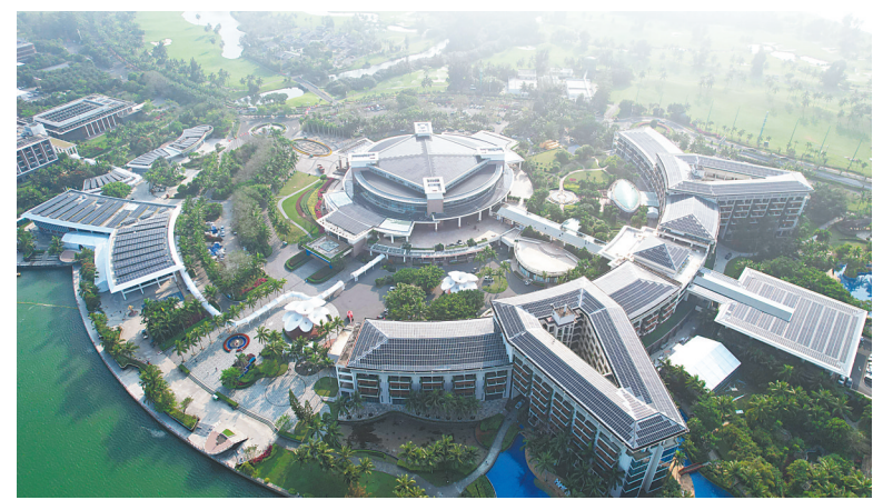
3月17日，在博鳌近零碳示范区拍摄的博鳌亚洲论坛会议中心及酒店改造项目。

据新华社海南博鳌3月18日电 3月18日，博鳌近零碳示范区运行启动会在海南琼海博鳌东屿岛举行，标志着这个由住建部和海南省政府共建的达到国际先进水平的示范区进入了近零碳运行阶段。