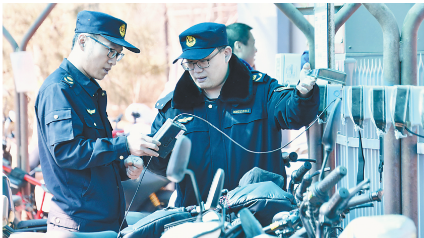
3月12日，安全生产检查人员在北京大兴区天宫院街道中里社区对电动自行车充电区域进行用电安全排查。

电池制造现场管控不当，电池内部可能会混入杂质、金属颗粒物等异物，随着电池使用时间延长，异物易刺穿隔膜发生内短路，出现热失控引发火灾。