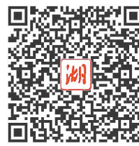
扫码阅读报告全文

报告从六个方面回顾了去年一年的工作：弘扬宪法精神，履行宪法使命，提高宪法实施和监督水平；抓住提高立法质量这个关键，推动中国特色社会主义法律体系更加科学完备、统一权威；用好宪法法律赋予人大的监督权，增强监督工作的针对性、实效性；加强人大代表工作能力建设，支持和保障代表更好依法履职；服