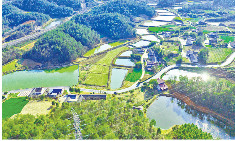
3月12日,当阳玉泉河开展小流域治理试点一线春意盎然,处处是景。

目前,当阳市正结合玉泉河河道岸坡治理,利用现有水塘,精心打造集生态、防洪、灌溉、休闲为一体的绿色生态景观。通过沿河两岸的生态缓冲带,河内建设多级生态湿地,玉泉河将重构自然生境。水流田地、林荫花溪、水绕村庄的乡村画