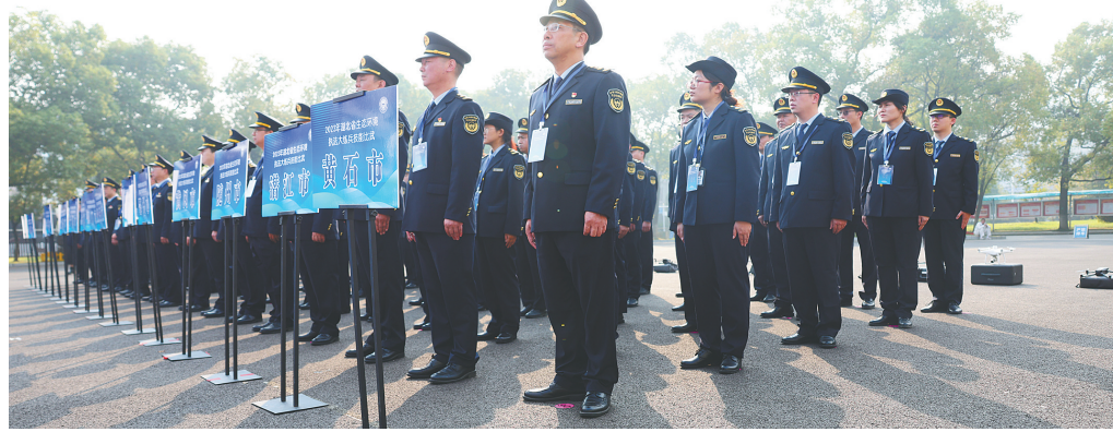
2023年10月26日,我省生态环境执法大练兵在大冶特钢拉开帷幕,推动生态环境执法不断取得新进展。

作为全省第一批生态环境执法机构A类示范单位,天门市生态环境保护综合执法支队聚焦执法办案主责主业,以实绩保护蓝天净土碧水,深入打好污染防治攻坚战。通过开展技能比武大练兵,天门持续提升执法人员基础执法素养,现场调查取证和装备运用等能力。2023年,天门市4名执法人员入选湖北省“百名尖兵”库,3名执法骨干入选湖北省师资库;上半年省级案卷评查中,天门市平均分99.3分,位列全省第二名。