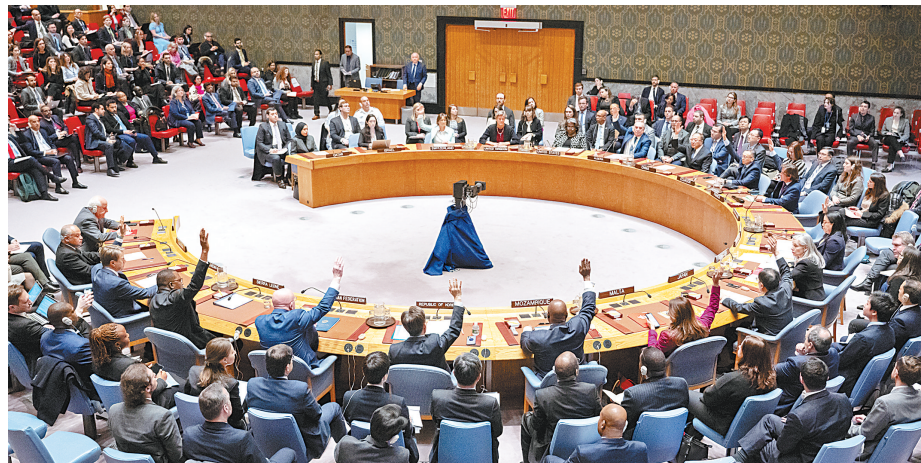
2月20日,位于纽约的联合国总部的安理会投票现场。

据新华社联合国2月20日电 联合国安理会20日就阿尔及利亚代表阿拉伯国家提出的要求在加沙地带立即实现人道停火的决议草案进行表决,因美国单独否决,决议草案未获通过。