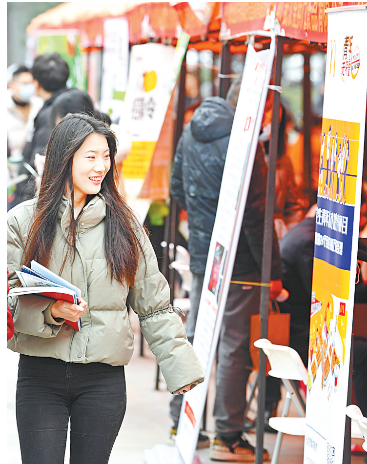
2月19日,武汉市武昌区在泛悦汇景华林中心广场举办新年首场“春风行动”招聘会,参会企业提供岗位近2000个,吸引不少市民和应届毕业生前来寻觅工作机会。