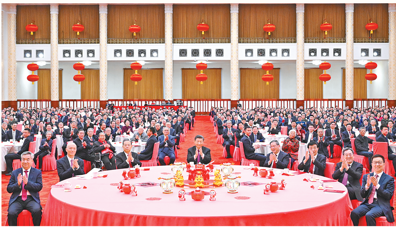
2月8日,中共中央、国务院在北京人民大会堂举行2024年春节团拜会。中共中央总书记、国家主席、中央军委主席习近平发表讲话。