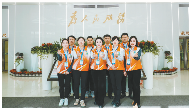
“光谷帮帮团”提供帮代办服务。

东湖高新区政务和大数据局相关负责人表示,同心山成玉,协力土变金。推进营商环境建设是一项大的系统工程,每个部门、每个单位、每个岗位都要把自己当成优化营商环境的重要一环,各职能单位要相互支持、统一步调、形成合力,从市场主体角度和立场出发,做好全生命周期服务保障,共筑一流营商环境,让市场主体生产经营好。东湖高新区政务和大数据局也将持续为企业“帮困”、为群众“解忧”,主动担当,矢志不移坚持“刀刃向内”、改革攻坚,初心不改打造一流的营商环境,为实现高质量发展打下坚实基础。