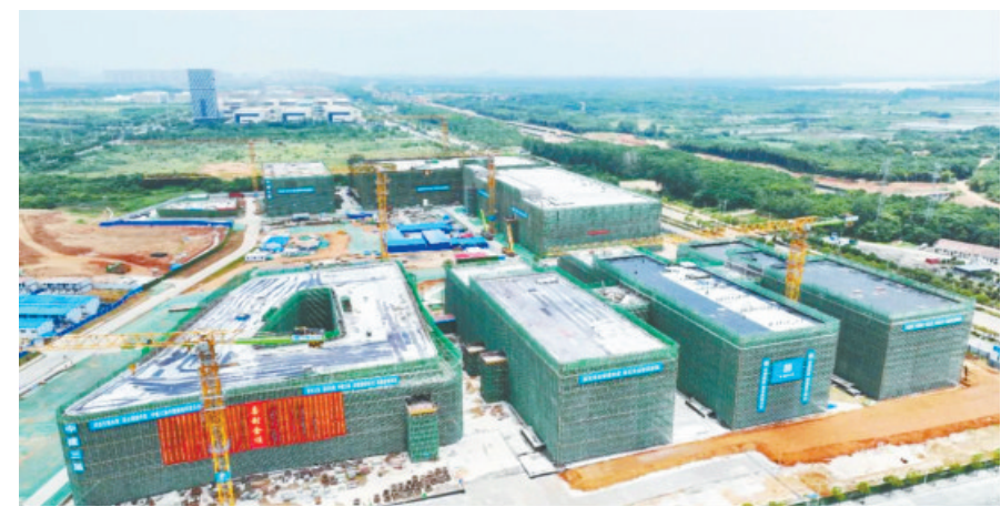
武汉光迅科技高端光电子器件产业基地建设项目一期厂房封顶现场。

据东湖高新区政务和大数据局相关负责人介绍,推动项目快速动工,不仅能为企业赢得市场先机,更能提升企业投资热情,释放市场活力。为此,东湖高新区政务和大数据局组建帮代办业务团队,为重大项目及其他有需求的工程建设项目提供政策咨询、部门沟通协调、审批进展跟踪等服务,受到办事企业的一致好评。