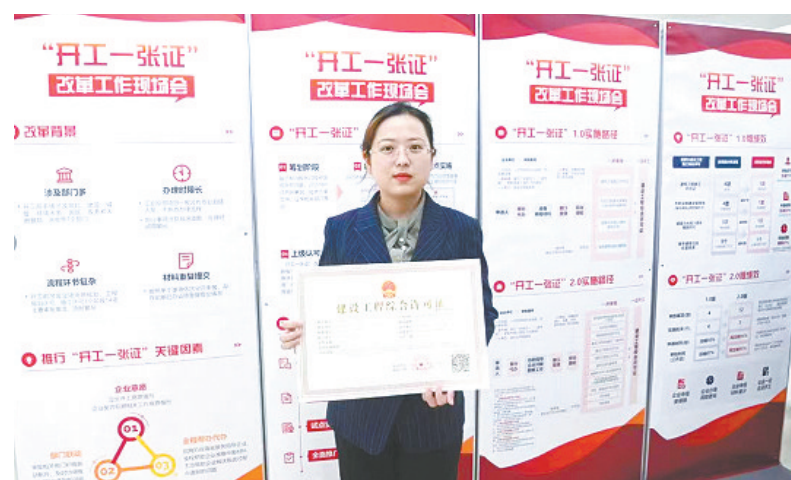
东湖高新区在全省首创的“开工一张证”提档升级至2.0版。

后期,企业明确开工意向后,党员先锋积极主动对接,帮助企业联系对接相关审批部门开辟绿色通道,每个环节全程跟进反馈、协调催办,最大限度压缩审批时限,为项目快速落地创造良好环境。