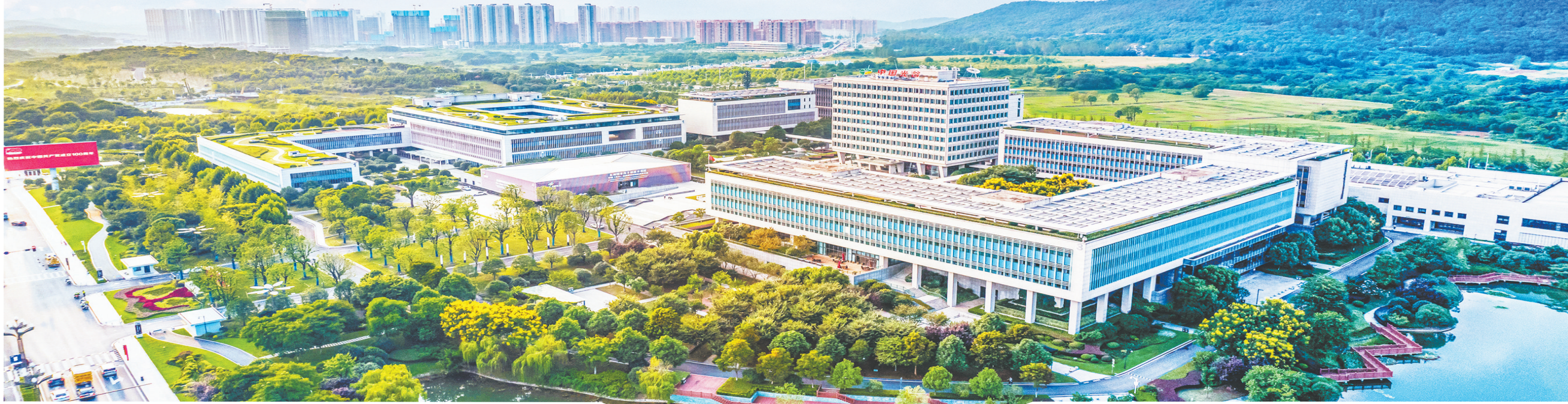
东湖高新区政务和大数据局鸟瞰图。

民生的根本要求,是矢志不渝转作风的应有之义。近年来,东湖高新区政务和大数据局聚焦市场主体反映的突出问题,对标先进,推出系列改革举措,形成了一批典型经验做法,重点聚焦企业和群众反映的痛点难点堵点,大力实施审批服务事项减材料、减时间、减程序、减跑动等“四减行动”。