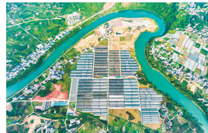
来凤县投绿谷生态大棚基地。