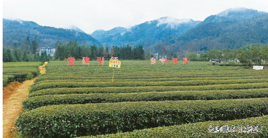
大河镇百福司茶园。

“做强产业，更要做优品牌。”来凤县农业农村局相关负责人介绍，近年来，来凤不断擦亮农产品品牌，“来凤藤茶”入围全国茶叶区域公用品牌前70强（排名第60名），召开首届国际藤茶大会，来凤县被授予“中国藤茶之乡”；来凤藤茶入选农业农村部农业品牌精品培育名单；创建“来凤西味”农产品区域公共品牌；来凤姜、来凤山茶油、来凤黄精、来凤蜂蜜、来凤皮蛋、土家腊肉等特色农产品受到消费者青睐，知名度不断提升；“来凤藤茶”“来凤凤头姜”获得国家地理标志产品保护，特色农业品牌正加速崛起。