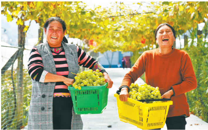
来凤县园果蔬专业合作社，农户高兴地采下最后一茬葡萄。

全国第一个土家族自治县来凤——坚持把农业农村发展作为县域经济发展的“压舱石”，聚焦藤茶、油茶、黄精、畜牧、粮食五大农业产业，持续注入动能，培植势能，挖掘潜能，产业链不断延伸，“新农人”持续涌现、农产品品质提升，带动农业稳产增产、农民稳步增收、农村环境改善，一幅产业强、农民富、生态美的新时代乡村振兴画卷正徐徐展开。