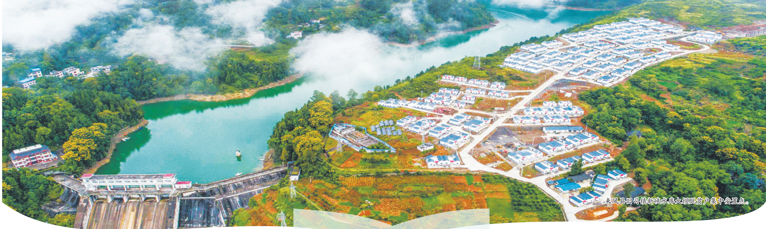
来凤县旧市镇新峡水库大坝坝后户集中安置点。