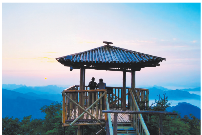
龙潭坪村开展共同缔造，村民自建来凤之巖小屋。