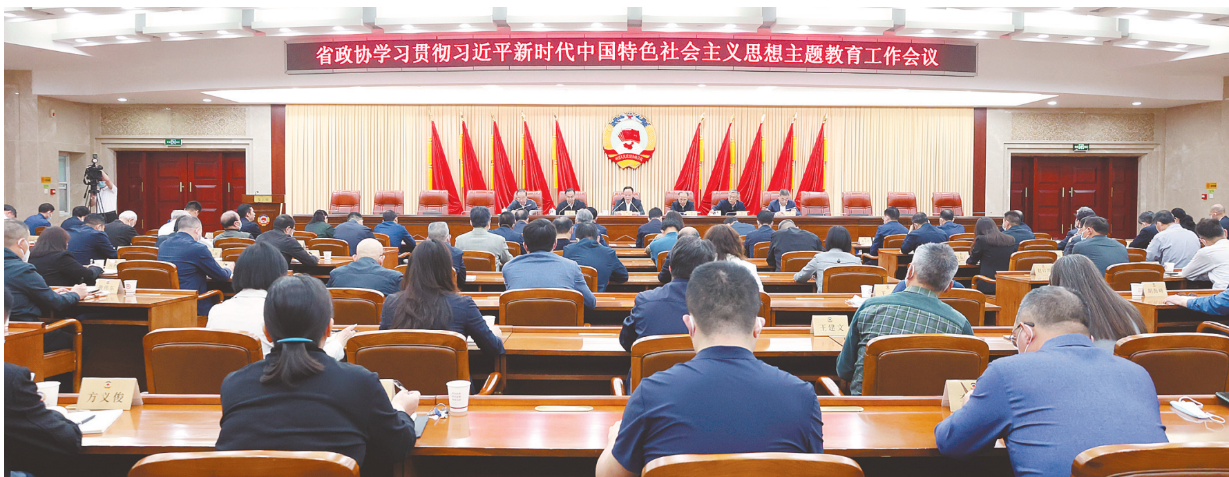
省政协召开学习贯彻习近平新时代中国特色社会主义思想主题教育工作会议。

2023年,在省委坚强领导下,在省政协大力支持下,政协湖北省委员会及其常务委员会坚持以习近平新时代中国特色社会主义思想为指导,全面贯彻落实中共二十大和二十届二中全会精神,深入贯彻习近平总书记关于加强和改进人民政协工作的重要思想、关于湖北工作的重要讲话和指示批示精神,深刻领悟“两个确立”的决定性意义,增强“四个意识”、坚定“四个自信”、做到“两个维护”。坚决贯彻中共中央决策部署,认真落实省委工作要求,坚持和完善中国共产党领导的多党合作和政治协商制度,坚持党的领导、统一战线、协商民主有机结合,坚持发扬民主和增进团结相互贯通、建言资政和凝聚共识双向发力,发扬优良传统,牢记政治责任,紧紧围绕中心服务大局,加强思想政治引领,积极建言资政,广泛凝聚共识,加强自身建设,充分发挥专门协商机构作用,为加快建设全国构建新发展格局先行区,加快建成中部地区崛起重要战略支点,奋力推进中国式现代化湖北实践贡献智慧和力量。