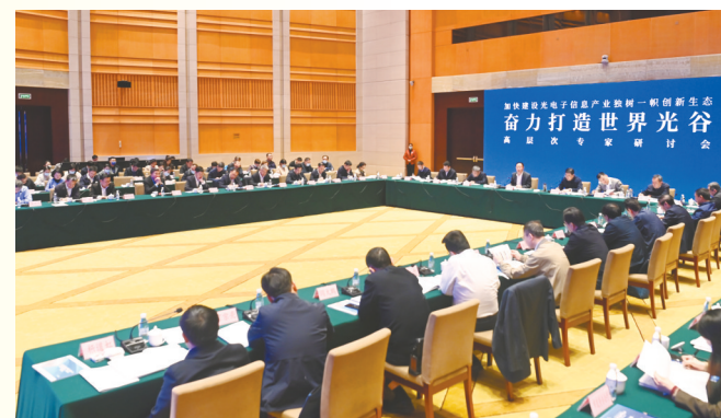
我省召开高层次专家研讨会,推进“充分发挥‘独树’优势,加快实现科技自立自强”全国政协重点提案办理。