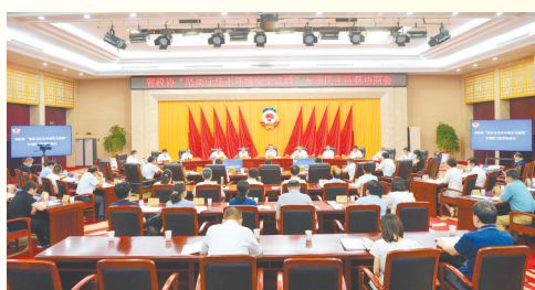
省政协召开“坚决守住水环境安全底线”专项民主监督会。