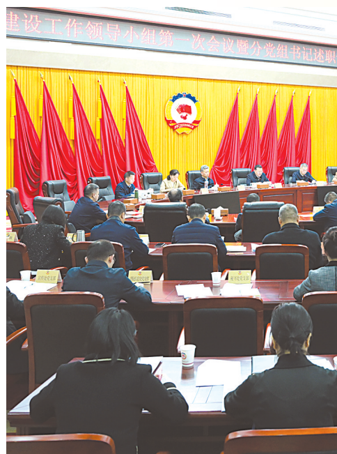
省政协召开党的建设领导小组第一次会议暨分党组书记述职评议大会。

加强与各民主党派、无党派人士、人民团体的经常性联系,更好发挥其在政协履职中的重要作用。密切与少数民族界、宗教界委员和代表人士的联系,促进民族团结、宗教和睦、社会和谐。通过推进鄂港合作机制有效运行对口协商会等会议活动,充分发挥港澳委员“双重积极作用”,认真做好在鄂台胞服务,广泛凝聚侨界侨智,积极开展人民政协对外交往,讲好湖北故事,扩大交流合作。