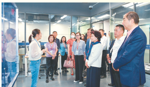
港区省级政协委员联谊会经贸文化考察团考察武汉大学尖端科技楼实验室。