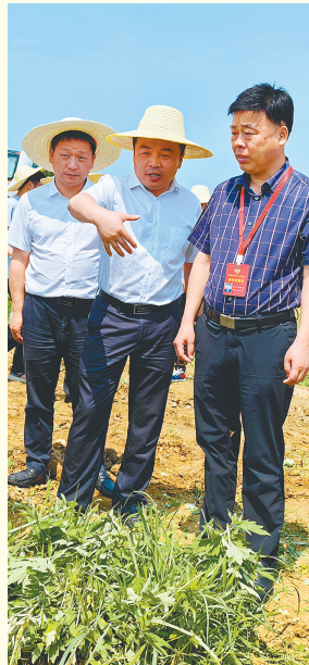
蕲春县政协组织委员在彭思镇蕲艾基地调研蕲艾收割机械化工作。