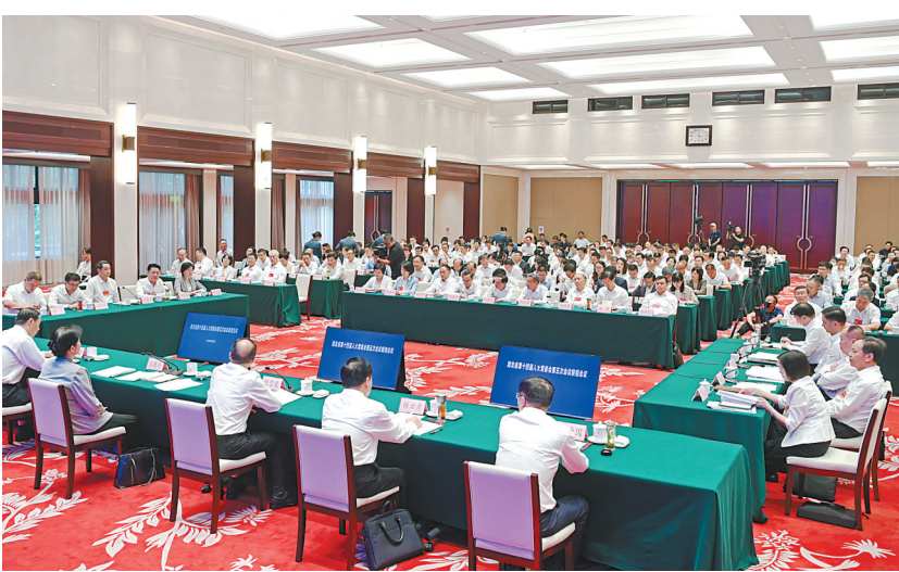
2023年9月26日,省十四届人大常委会第五次会议召开,在听取和审议省政府关于全省安全生产工作情况的报告的基础上,举行联组会议,聚焦安全生产开展专题询问。